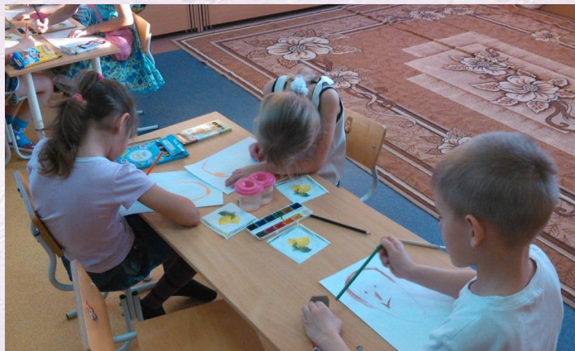
НОД «Моя мама»