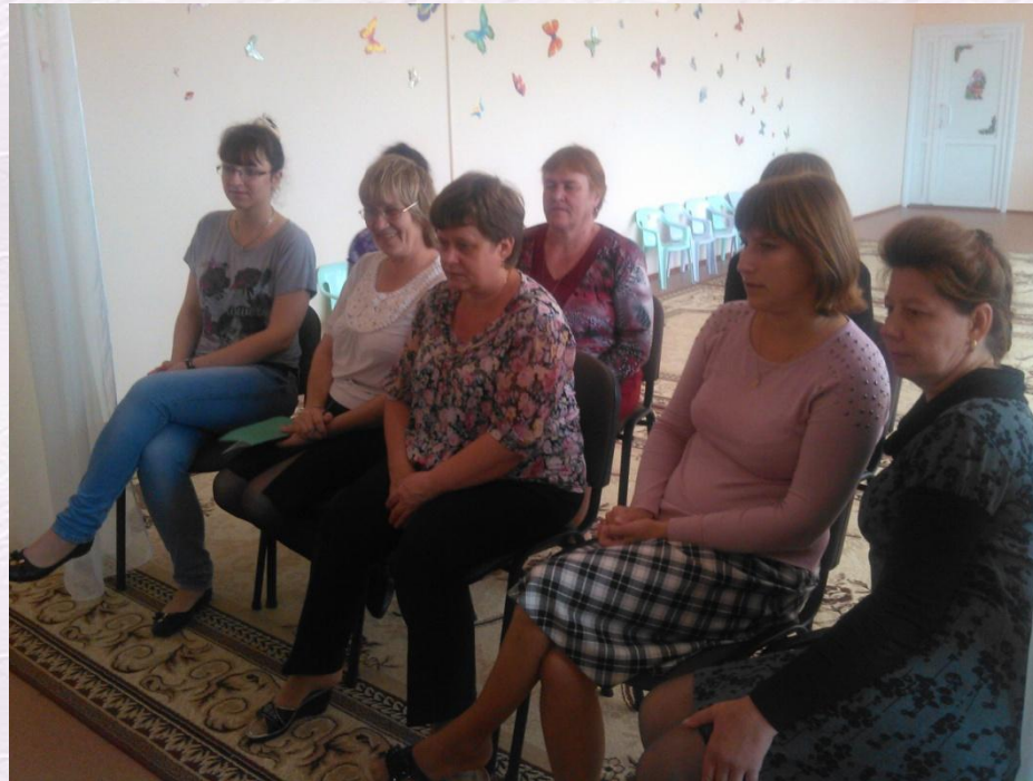
Вебинар сайта Мерсибо