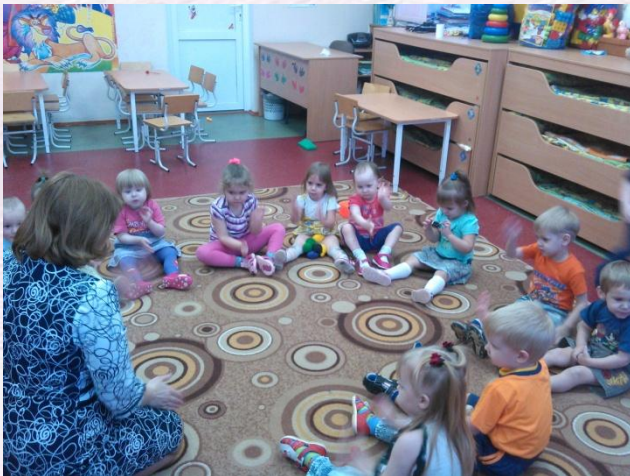
Просмотр работы кружка