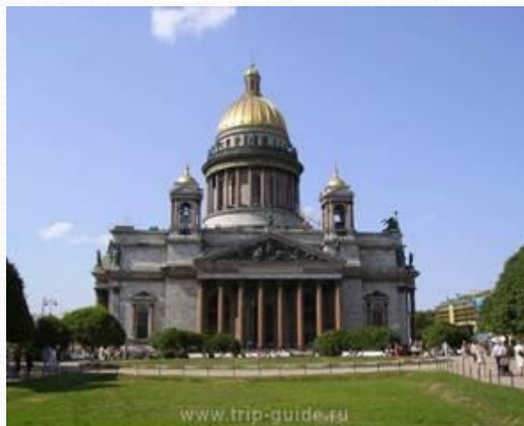
Главный храм Санкт-Петербурга – Исаакиевский собор.