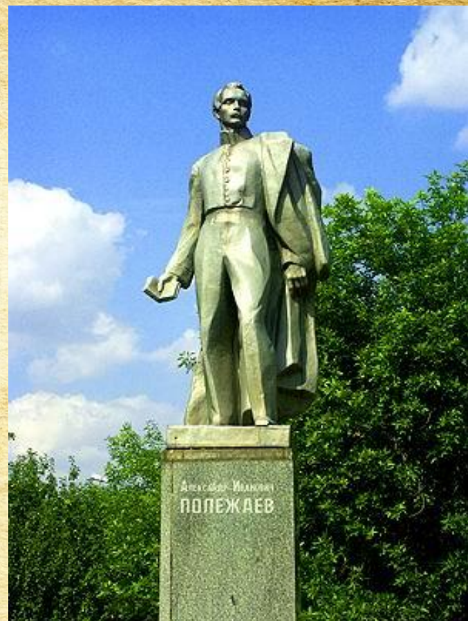
Памятник А.И. Полежаеву открыт в 1967 году.