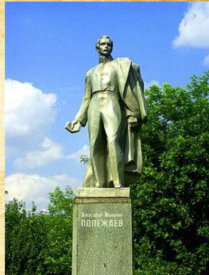
Памятник А.И. Полежаеву открыт в 1967 году.