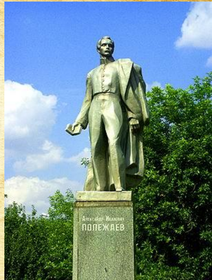
Памятник А.И. Полежаеву открыт в 1967 году.