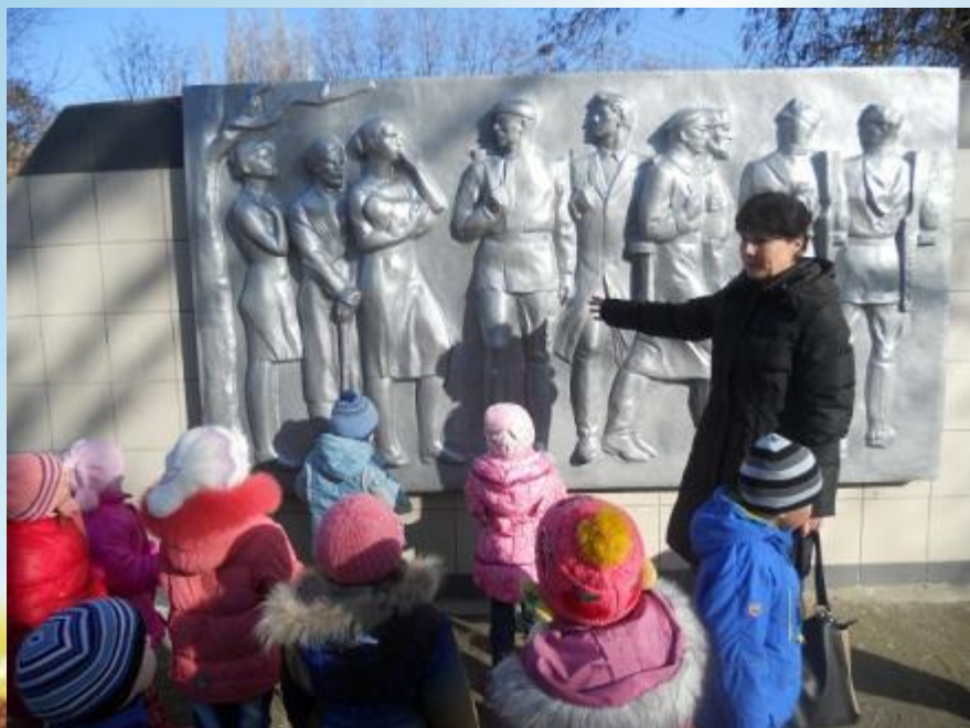
Возле памятника Воину-Освободителю