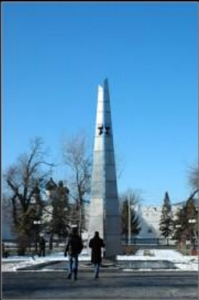
г. Дзержинск. Монумент возле Вечного огня