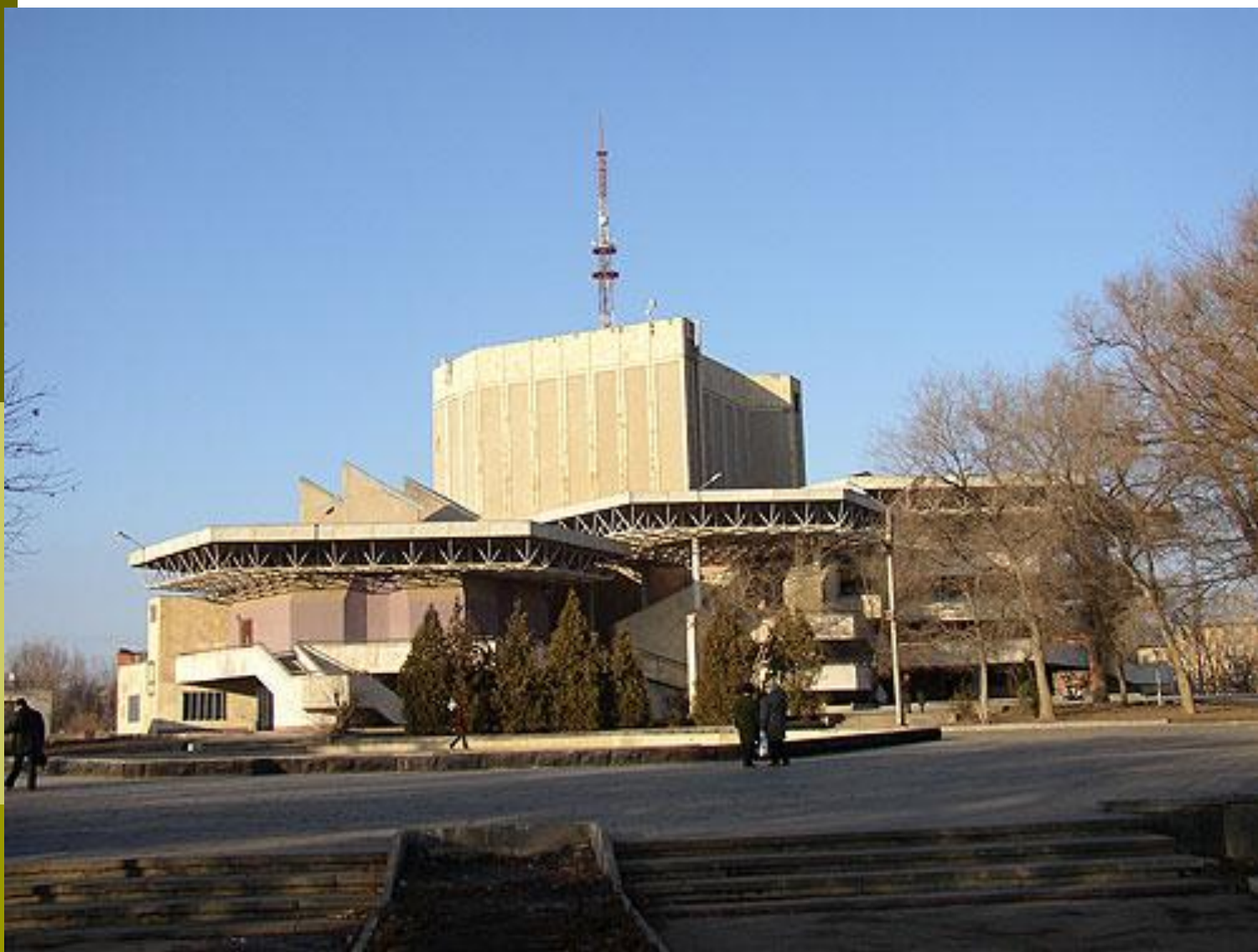
□ Парк Аркадия