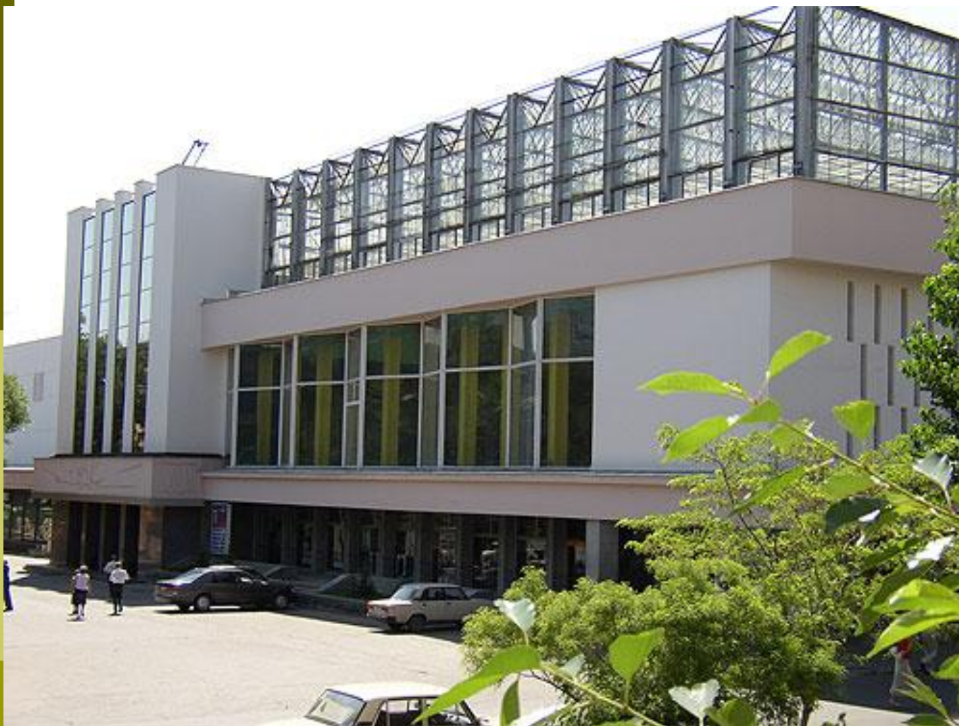
□ Кинотеатр «Октябрь»