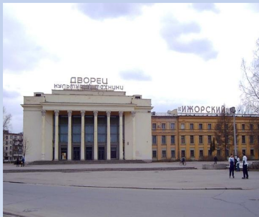
Дворец культуры «Ижорский»