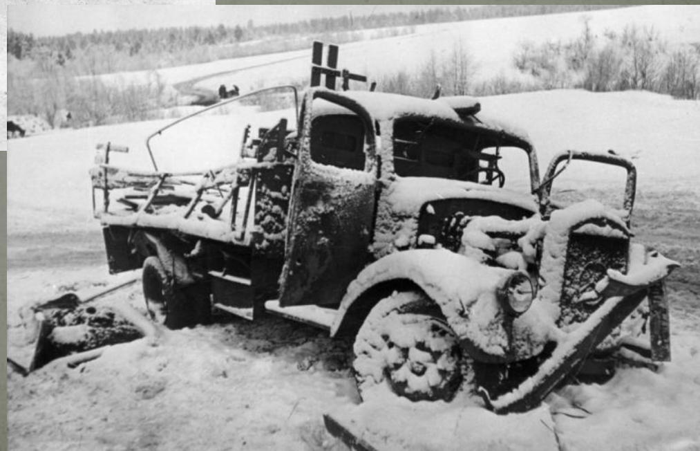
Разбитый и брошенный при отступлении немецкий грузовик Мерседес-Бенц L3000