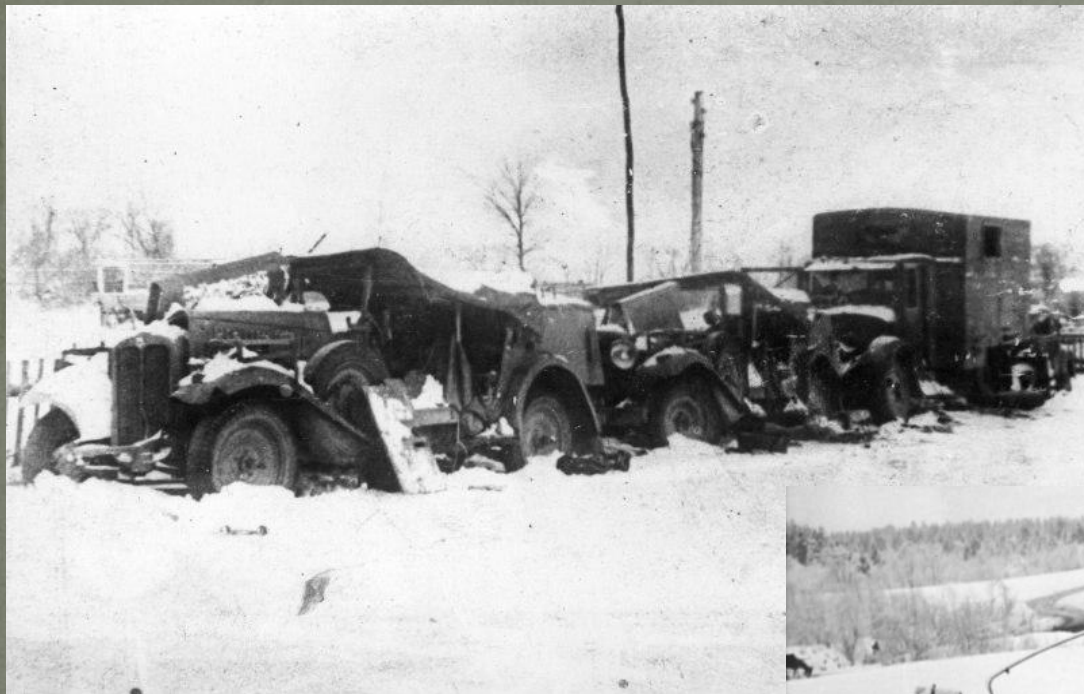
Разбитая немецкая автоколонна в районе деревни Крюково.

останавливались, преследовали врага, выгоняя его из наших деревень и городов. Деревня Крюково была освобождена от немецких войск 7 декабря 1941 года