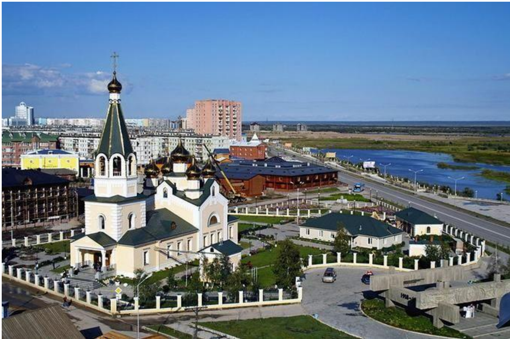
Столица Якутии – город Якутск