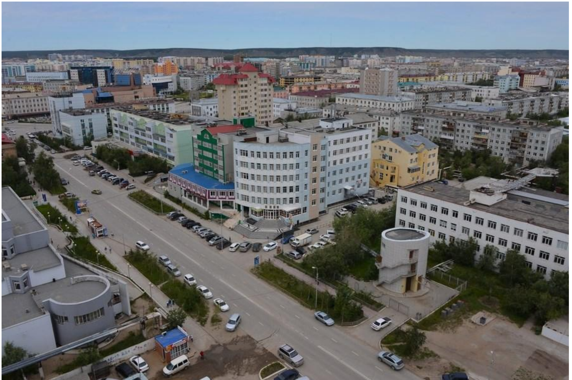
Это большой город