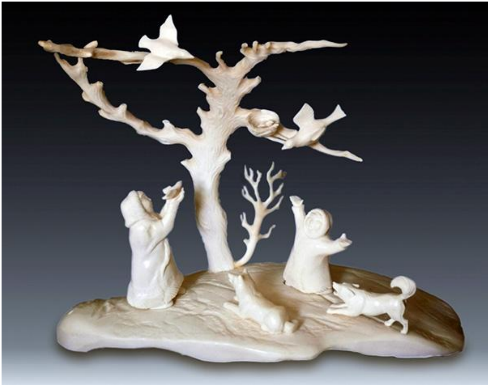
Главные промыслы Якутии – резьба по кости,