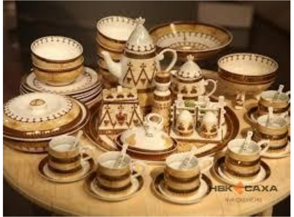
Резьба по дереву