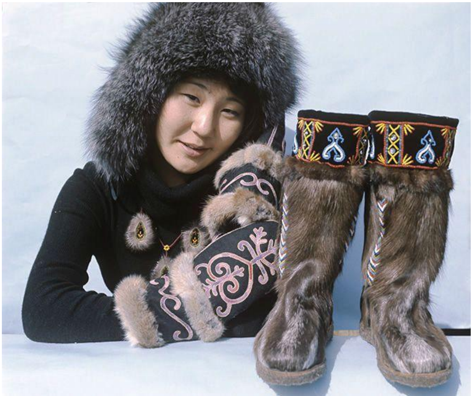
Добыча меха и изготовление меховой одежды