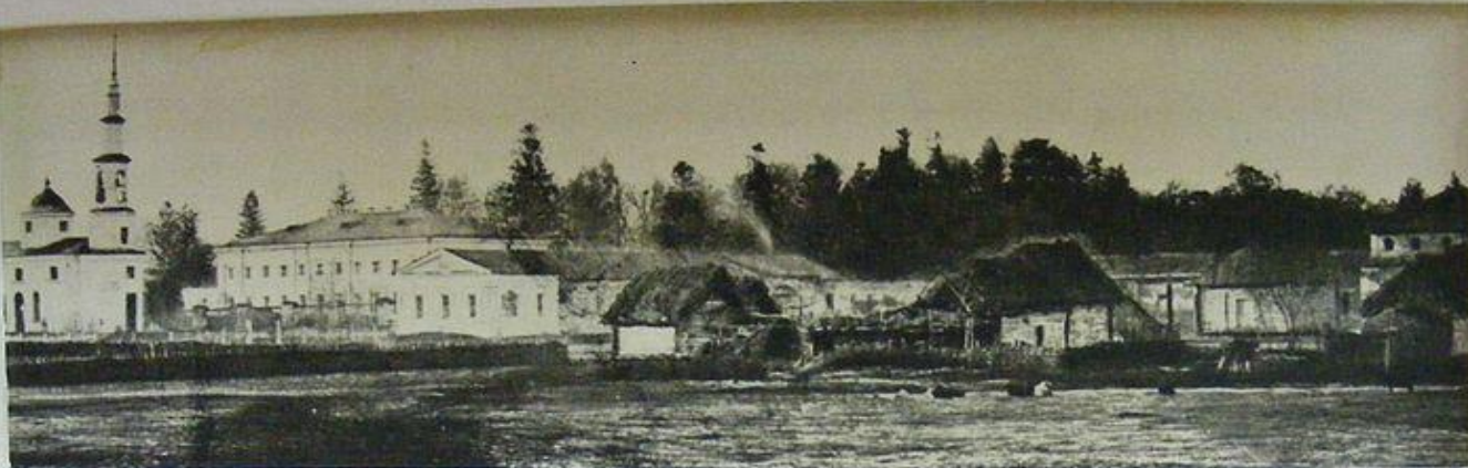
ВИД УСАДЬБЫ СТРУЙСКИХ СО СТОРОНЫ г. ПЕНЗЫ. ФОТО 1886 г.