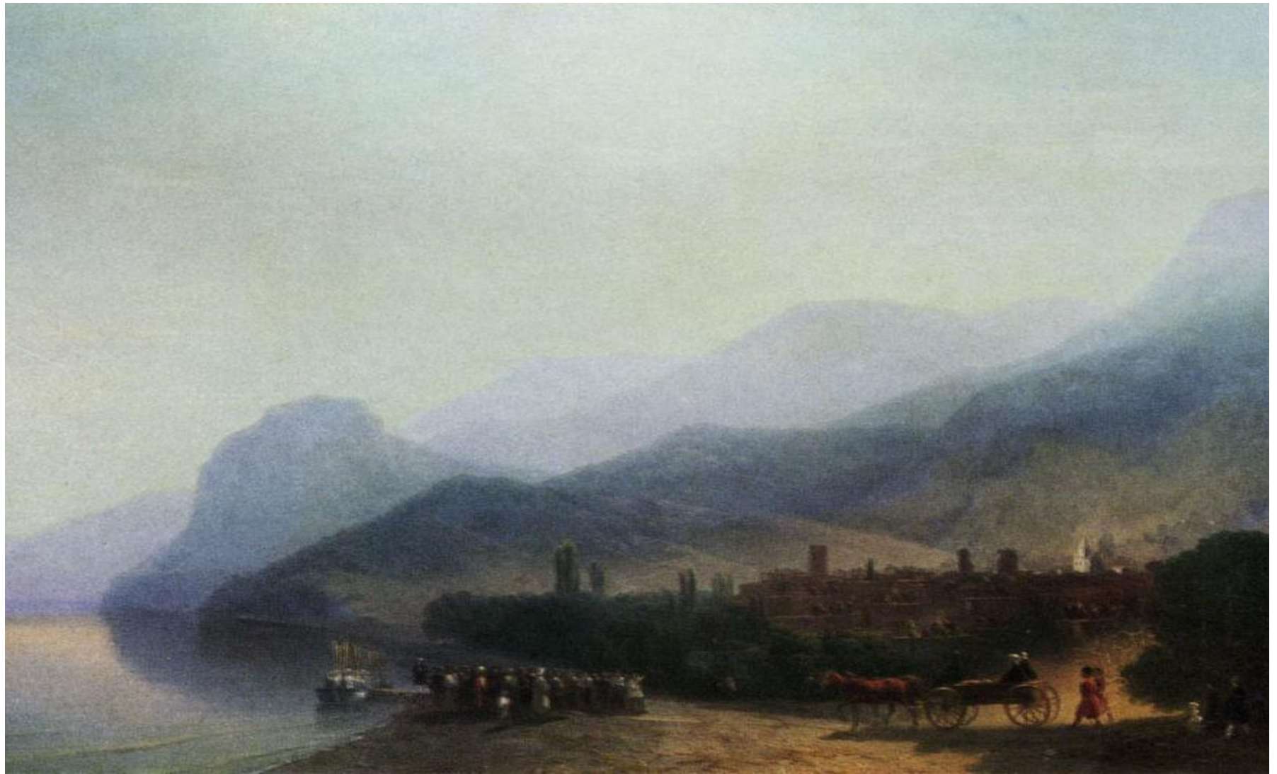
И. Айвазовский. Алушта