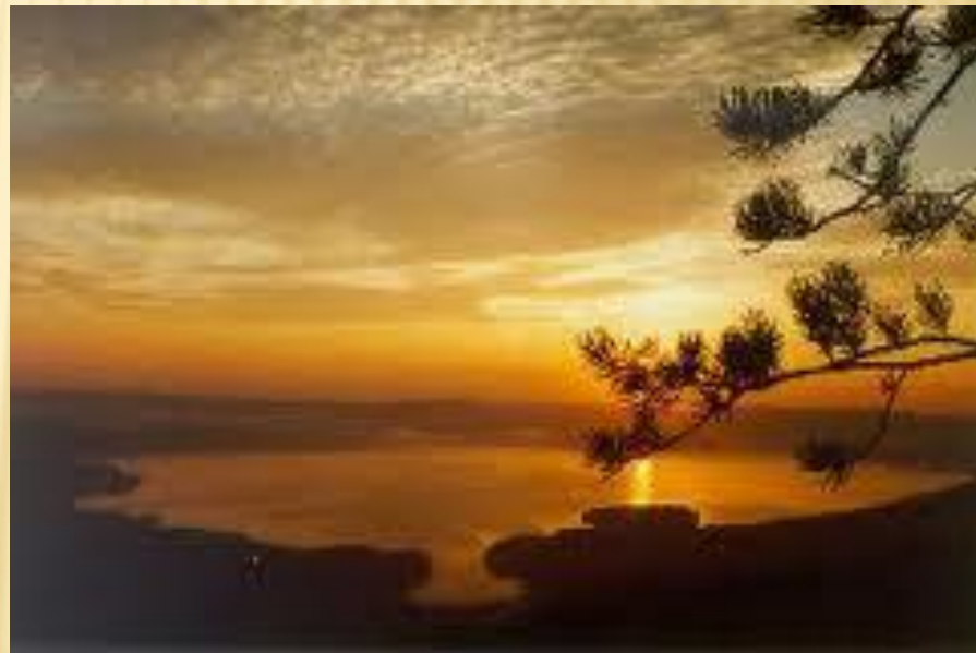
Это самое прозрачное озеро на Урале.