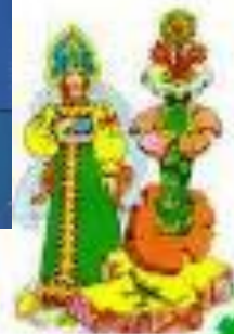
Пересказ сказки по мнемотаблице