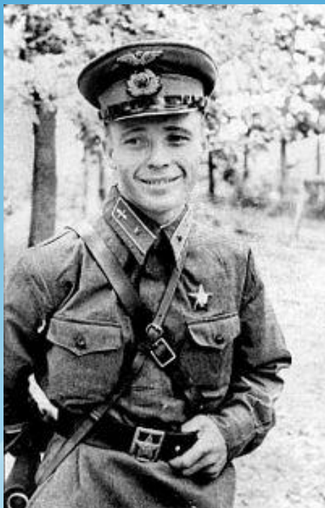
Виктор Талалихин. Лето 1941 года

ЗВАНИЕ ГЕРОЯ СОВЕТСКОГО СОЮЗА С ВРУЧЕНИЕМ ОРДЕНА ЛЕНИНА И МЕДАЛИ "ЗОЛОТАЯ ЗВЕЗДА" ВИКТОРУ ВАСИЛЬЕВИЧУ ТАЛАЛИХИНУ ПРИСВОЕНО УКАЗОМ ПРЕЗИДИУМА ВЕРХОВНОГО СОВЕТА СССР ОТ 8 АВГУСТА 1941 ГОДА ЗА ПЕРВЫЙ В ИСТОРИИ АВИАЦИИ НОЧНОЙ ТАРАН ВРАЖЕСКОГО БОМБАРДИРОВЩИКА