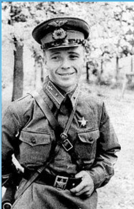
Виктор Талалихин. Лето 1941 года

ЗВАНИЕ ГЕРОЯ СОВЕТСКОГО СОЮЗА С ВРУЧЕНИЕМ ОРДЕНА ЛЕНИНА И МЕДАЛИ "ЗОЛОТАЯ ЗВЕЗДА" ВИКТОРУ ВАСИЛЬЕВИЧУ ТАЛАЛИХИНУ ПРИСВОЕНО УКАЗОМ ПРЕЗИДИУМА ВЕРХОВНОГО СОВЕТА СССР ОТ 8 АВГУСТА 1941 ГОДА ЗА ПЕРВЫЙ В ИСТОРИИ АВИАЦИИ НОЧНОЙ ТАРАН ВРАЖЕСКОГО БОМБАРДИРОВЩИКА