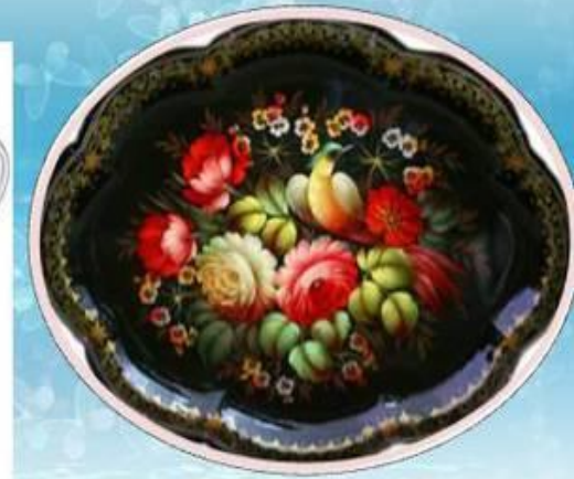
Жостово Страна Мам.ру