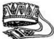
ДЕВИЧЬИ УБОРЫ Повязка