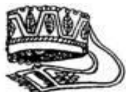
ДЕВИЧЬИ УБОРЫ Повязка