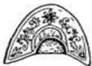
Кокошник. Владимирская губерния