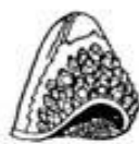
Кокошник. Псковская губерния