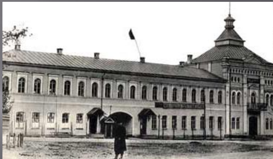
Женская гимназия. Начало XX века.