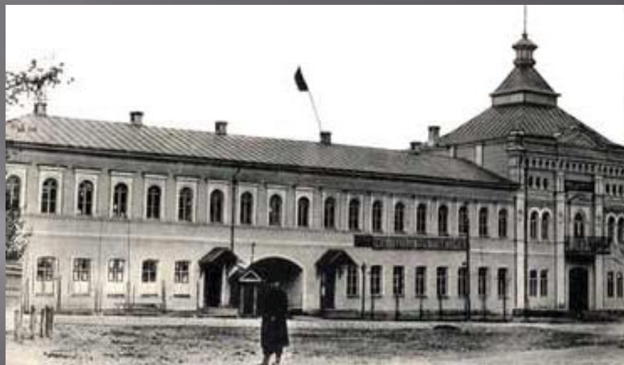
Женская гимназия. Начало XX века.