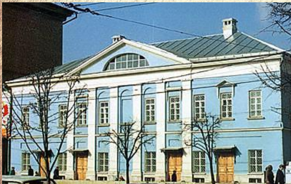
Мемориальный музей Н. И. Белобородова

Так играй, гармонь из Тулы! Весели народ честной! Ты всегда была и будешь – Тульской, славной, заводной!