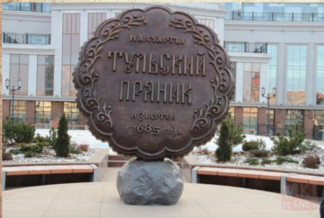
памятник Тульскому прянику