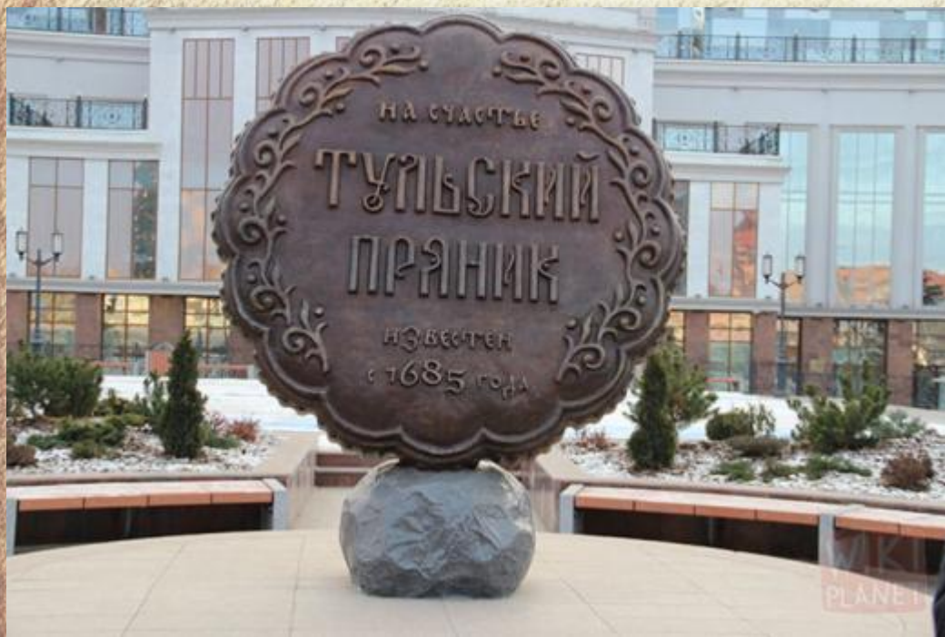
памятник Тульскому прянику