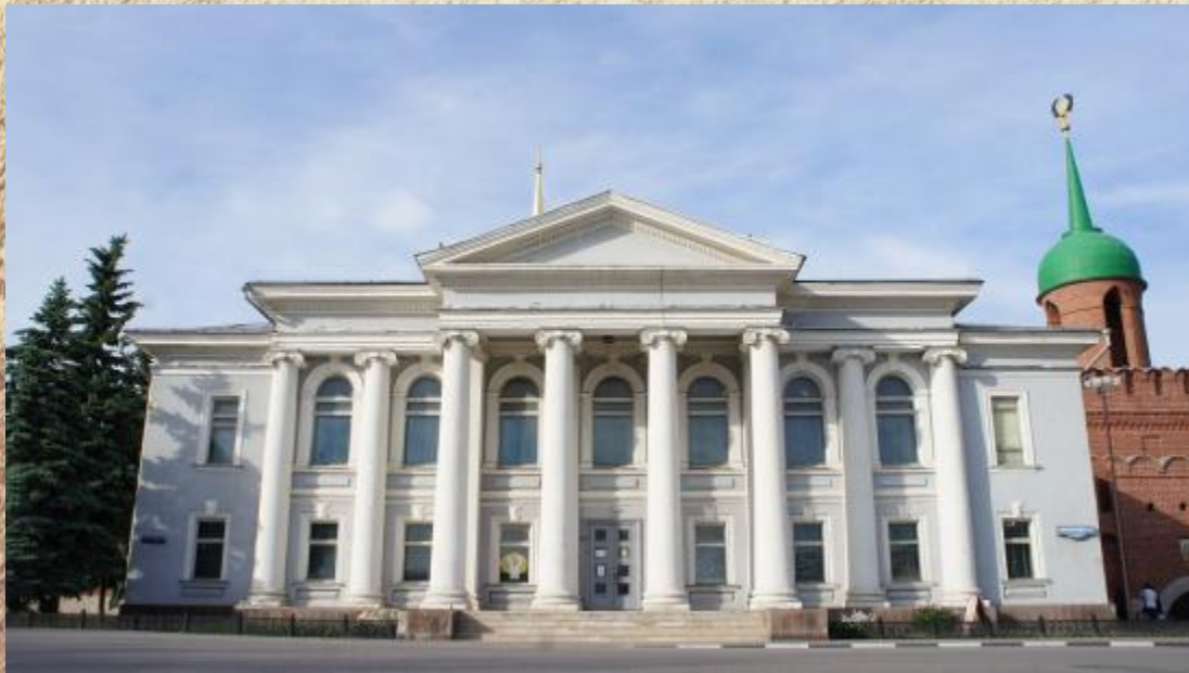
Музей самоваров в