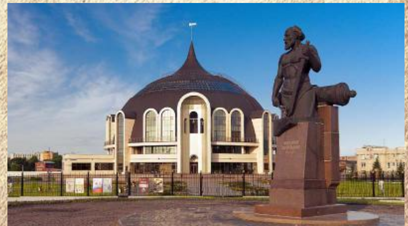
Тульский музей оружия выполненный в форме шлема