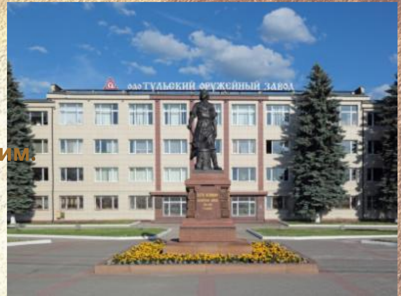
Тульский оружейный завод

Тула веками оружие ковала, Стала похожа сама на ружьё - Слышится звон боевого металла В древних названиях улиц её