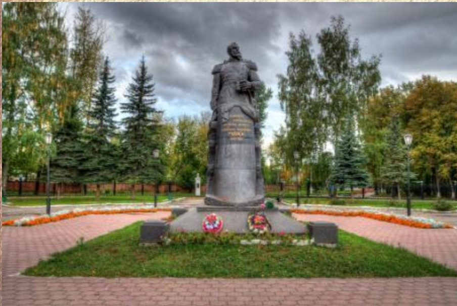
Памятник В.Ф. Рудневу командиру крейсера Варяг

Для врагов наш город страшен Он могуч стеной штыков. Будут петь потомки наши О героизме туляков.