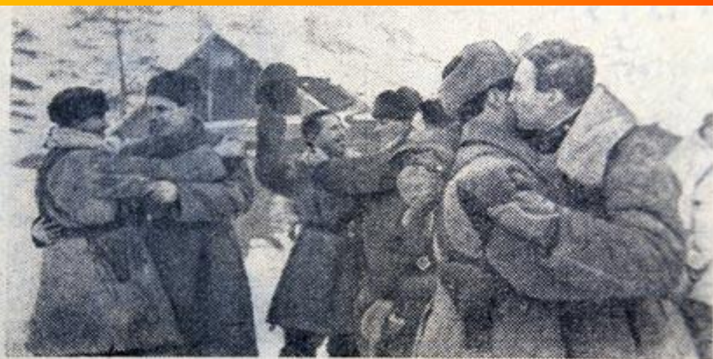
Блокада Ленинграда прорвана! НА СНИМКЕ: встреча бойцов и командиров Волховского и Ленинградского фронтов.