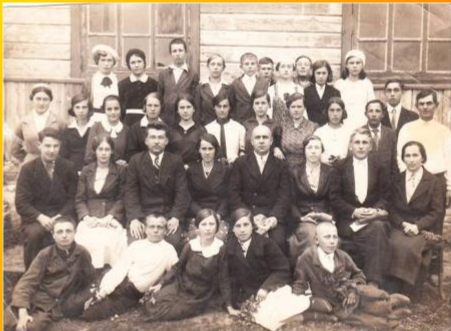
Июнь 1940 года. 7 «А» класс

В начале войны работал завучем, преподавал химию и биологию в сельской школе Новониколаевского района.