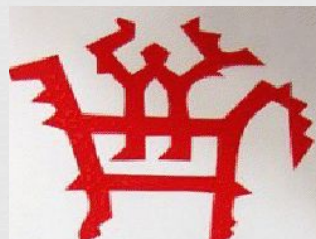
Человек на лошади