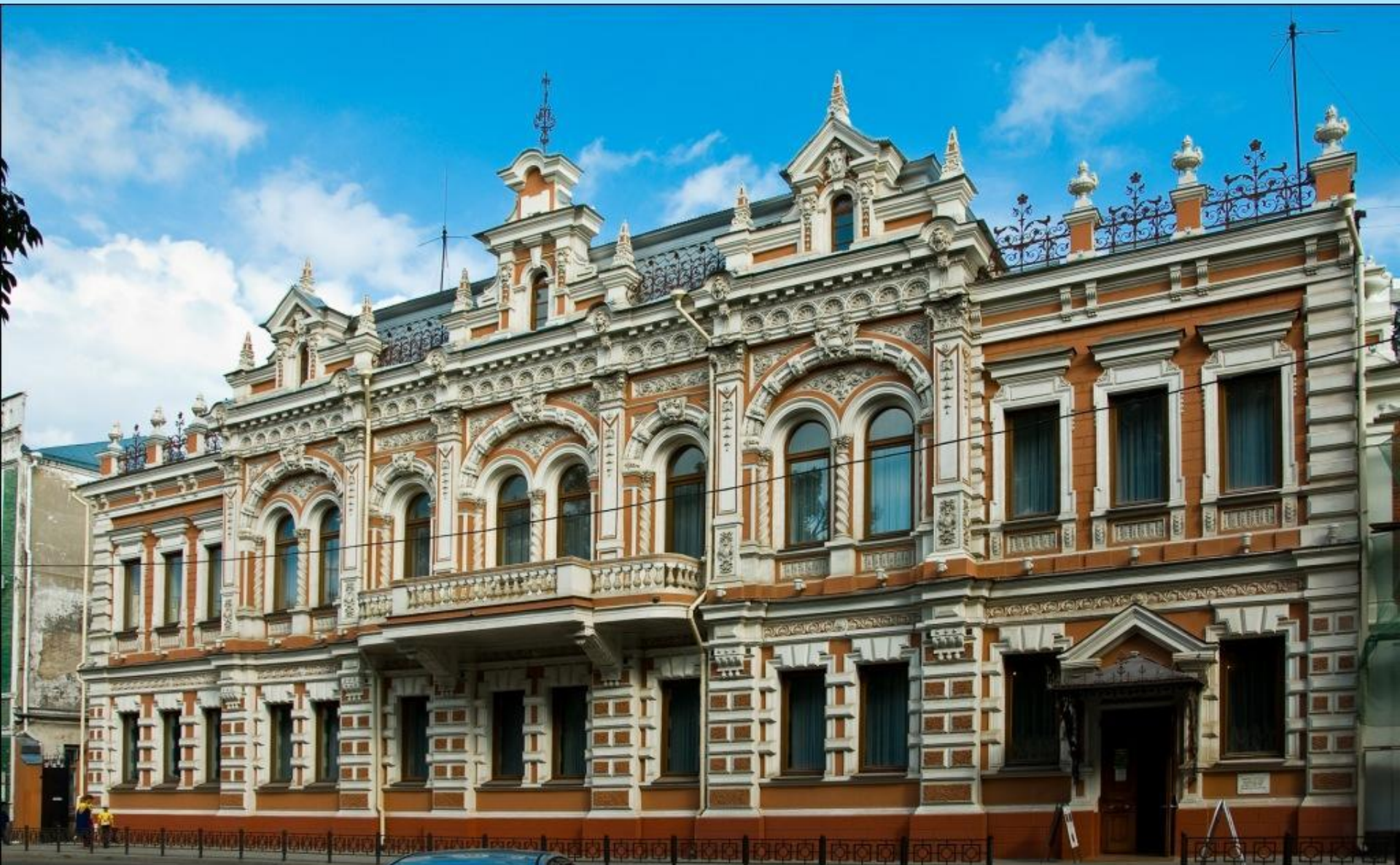
Краснодарский государственный историко-археологический музей-заповедник им. Е.Д. Фелицына