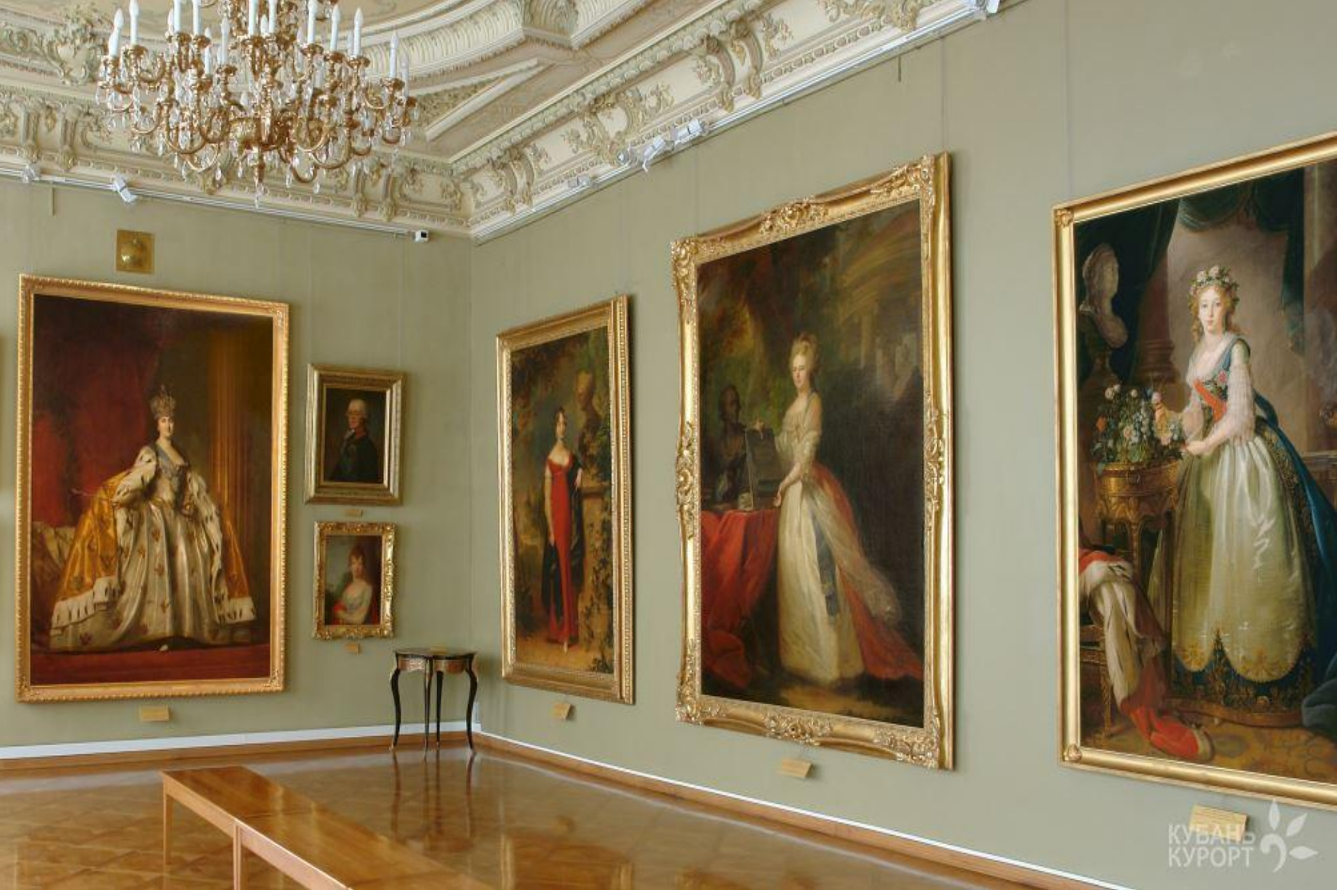
Краснодарский краевой художественный музей им. Ф.А.Коваленко