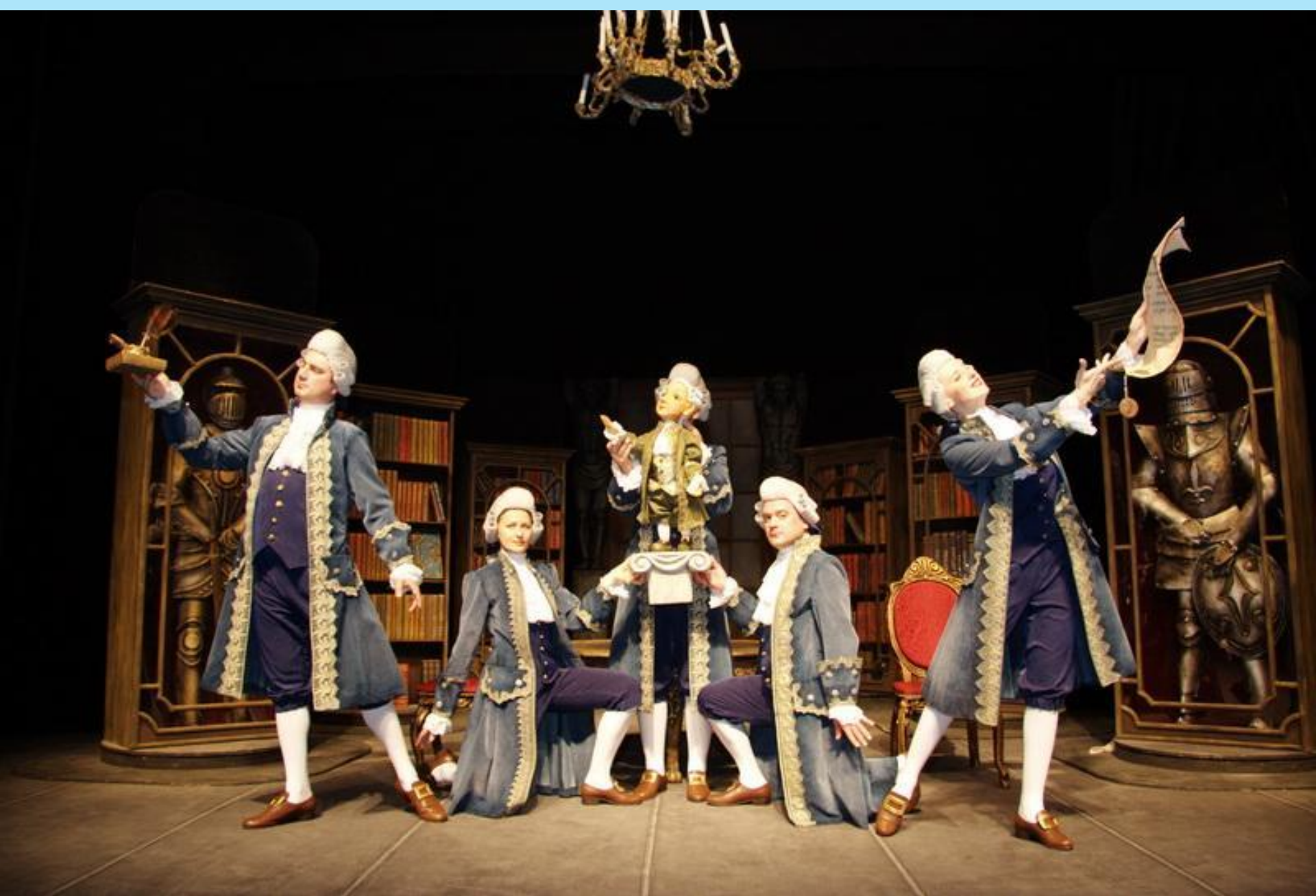
Краснодарские краевой театр кукол