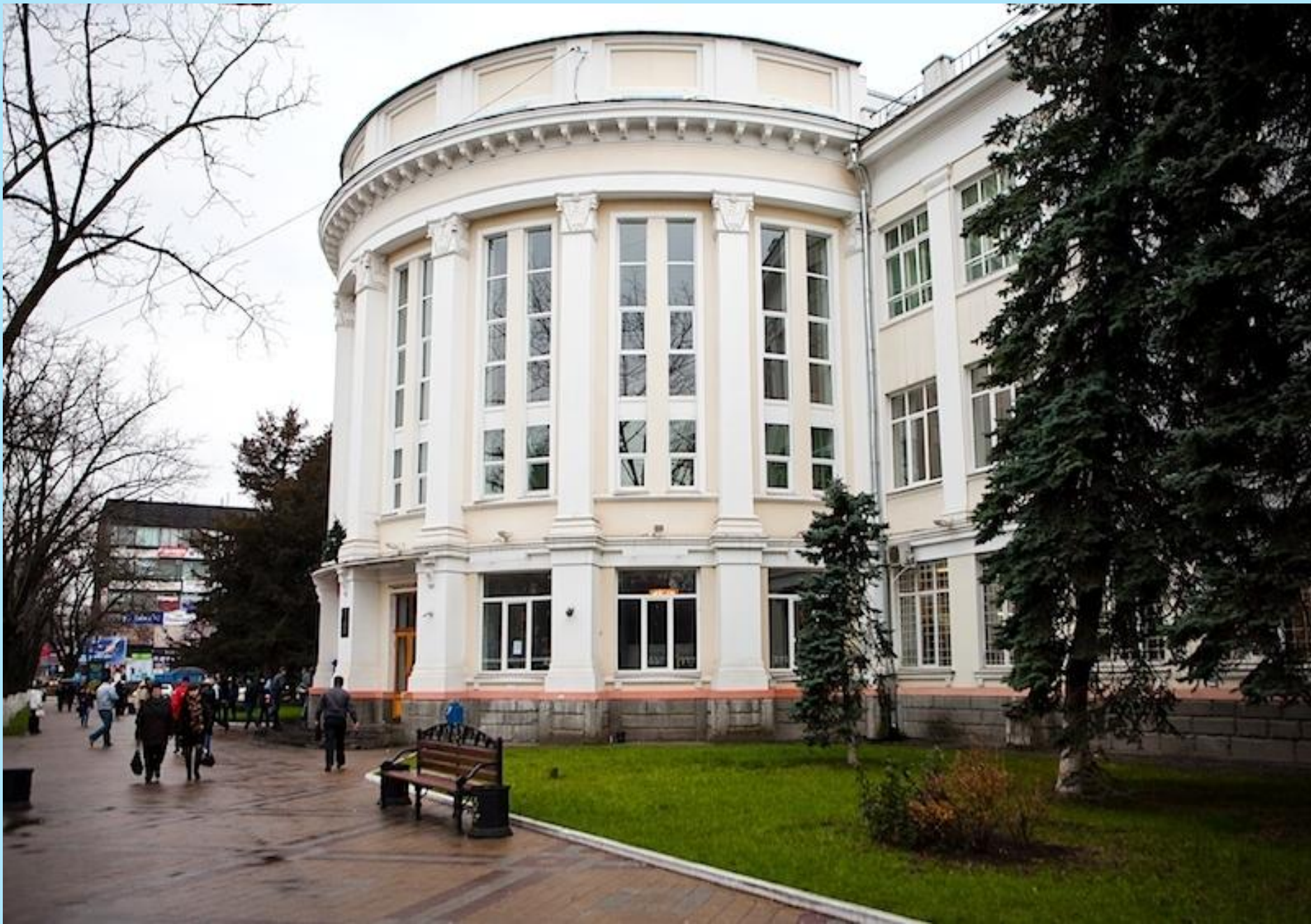
Кубанский государственный технологический университет