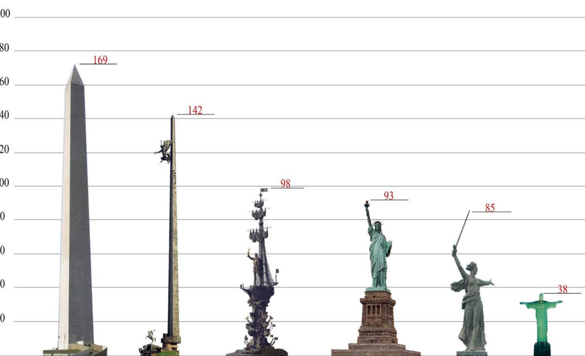
Robert Mills Monument to George Washington Washington, U.S.A. 1885