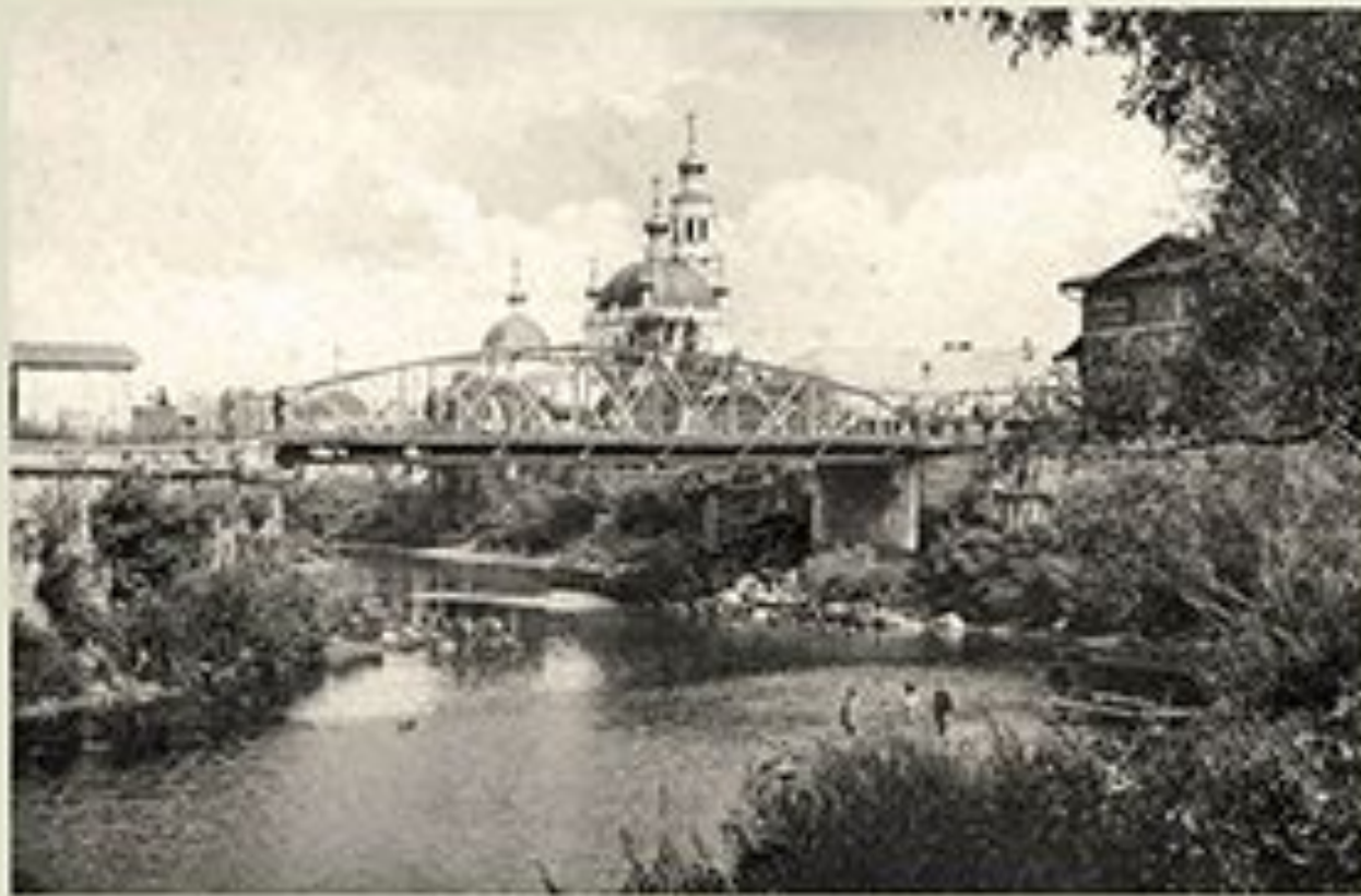
Мост через реку Гзарть.