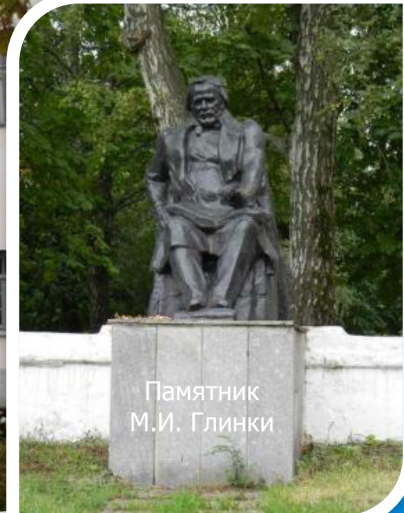
Памятник М.И. Глинки

В городе есть все возможности для культурного досуга и эстетического образования. Отличная библиотека, замечательные дворцы культуры, культурно - деловой центр, драматический театр, музыкальный колледж. Любимый горожанами муниципальный симфонический оркестр – лауреат многих международных конкурсов – много концертирует за рубежом.