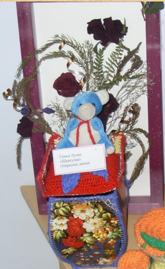
Семья Лузан «Швагулка» Открытие, нитки