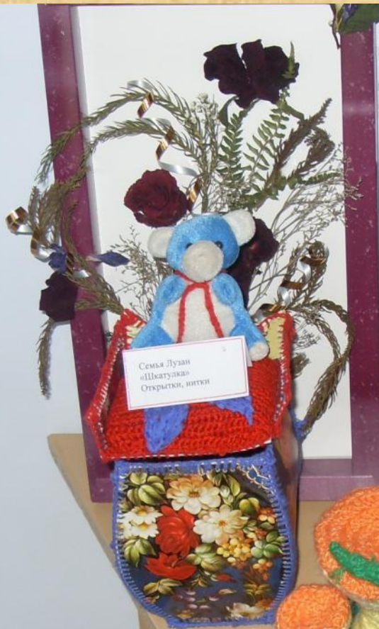
Семья Лузан «Швагулка» Открытие, нитки