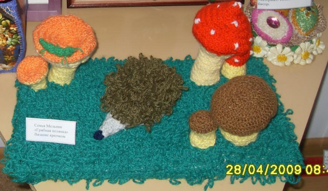
Семья Мельник «Грибная полянка» Вязание крючком