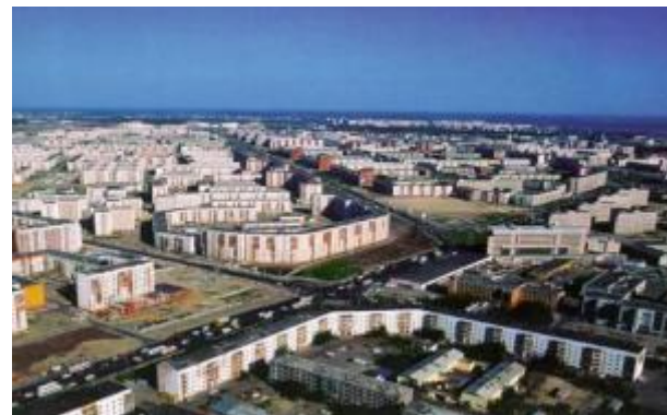
Здание Администрации города