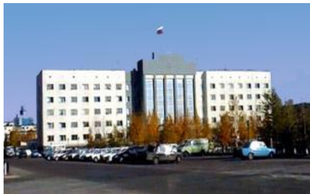
Здание Администрации города