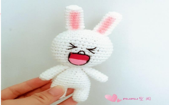
Зайчик в японском стиле.