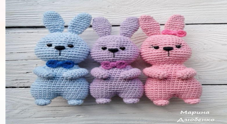
Зайчики в британском стиле.