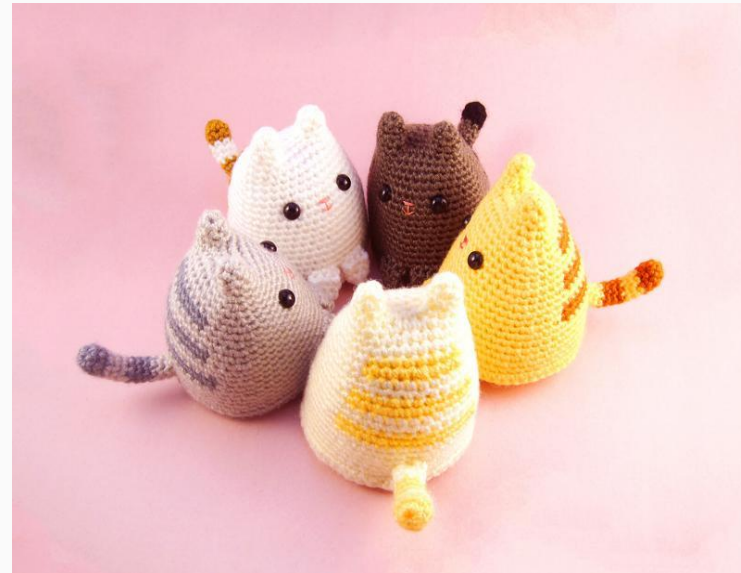
Котята в американском стиле.