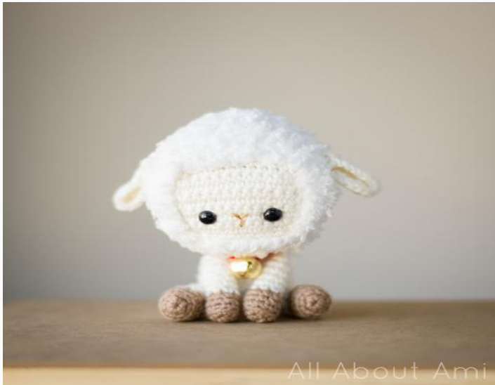
Овечка в английском стиле.