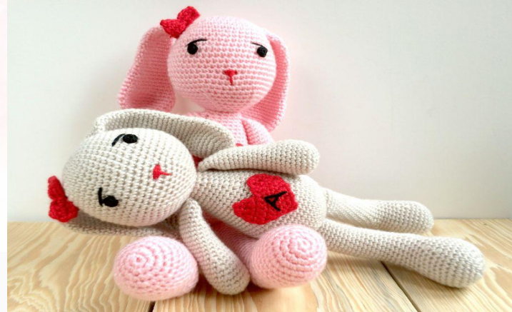
Зайчики в французком стиле