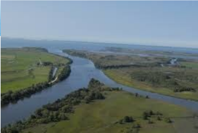
Дельта реки Неман

Область богата реками. Всего по территории области протекает 148 рек длиной более десяти километров. Крупные реки: Неман (с притоком Шешупе) и Преголя (с притоком Лава). Многочисленные озера. Самое большое озеро Виштынецкое.