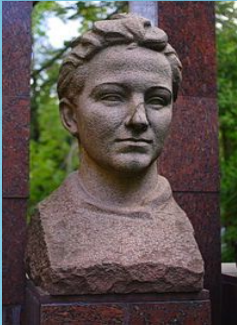
Памятник возле московской школы № 201