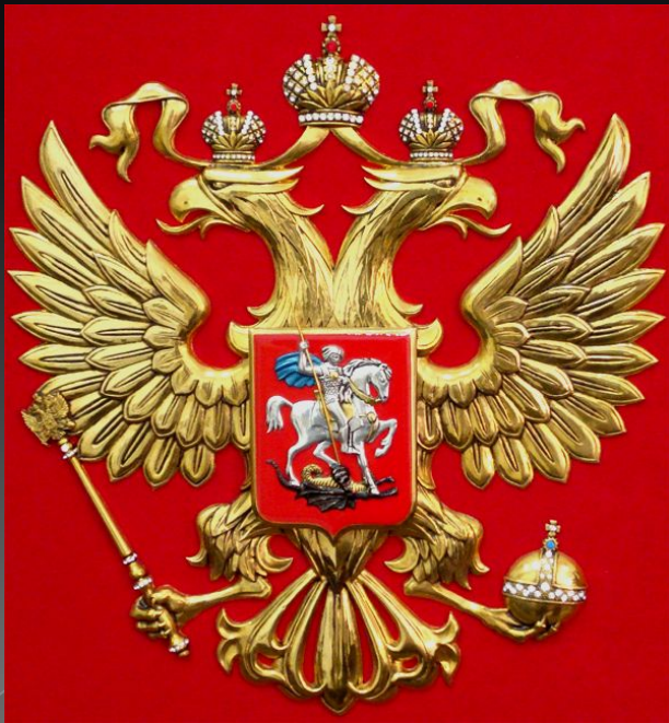
Герб Российской Федерации

Россия – священная наша держава, Россия – любимая наша страна. Могучая воля, великая слава – Твоё достоянье на все времена!