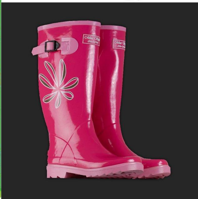
Сапоги из резины