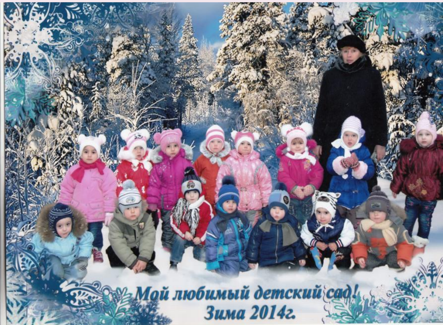
Мой любимый детский сад! Зима 2014г.