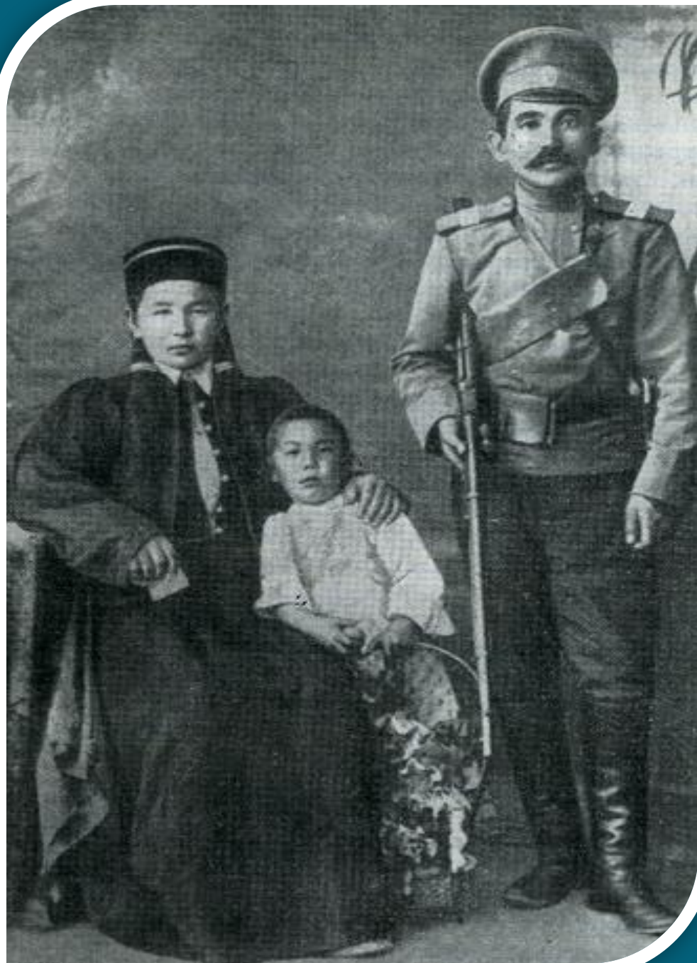
О.И. Городовиков с женой и дочерью. 1916 год