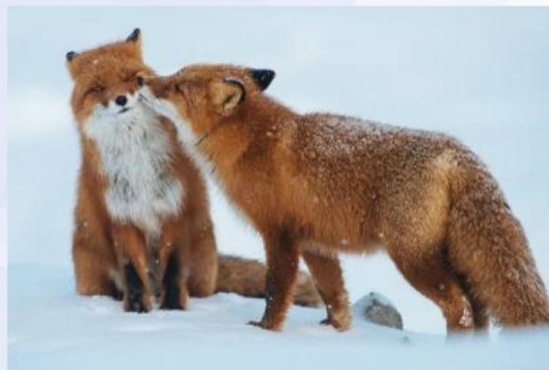
Лисички — лесные звери

ОМОНИМЫ — это слова, одинаковые по звучанию, но совершенно разные по лексическому значению