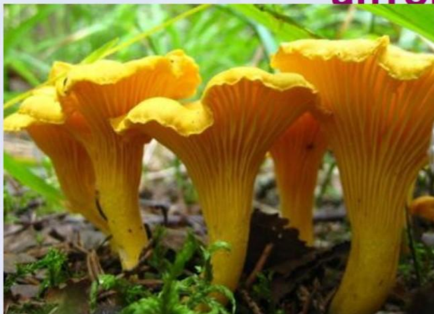
Лисички - грибы

В стихотворении речь идёт о совершенно разных словах – словах- антонимах