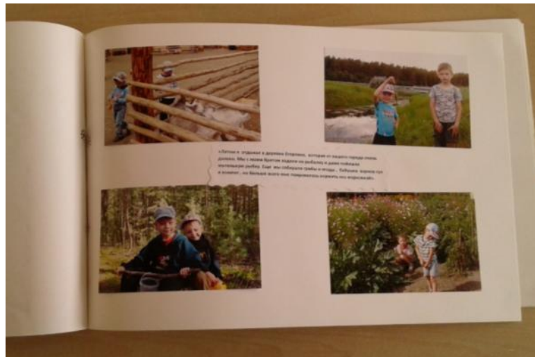
Альбом с фотографиями и рассказами детей о любимых местах отдыха