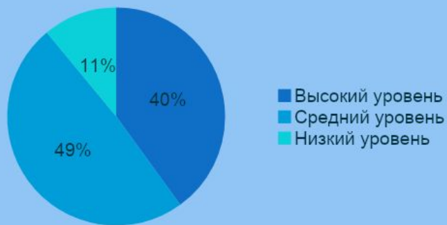
Уровень развития на начало учебного года