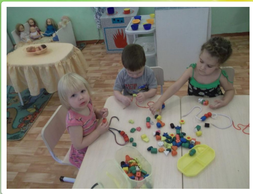
«Собираем бусы» башенка»