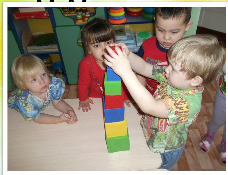
«Не упади, высокая башенка»