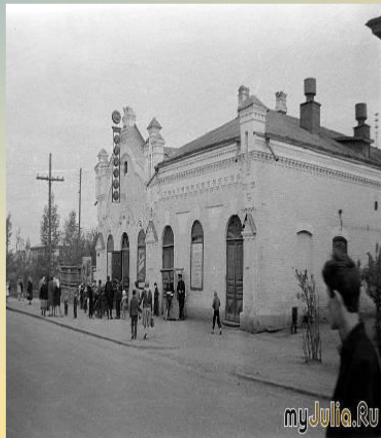
Кинотеатр «Кайтым» 1970 год