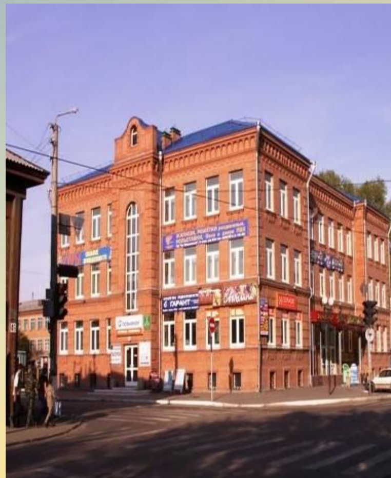
Отделение пенсионного фонда России