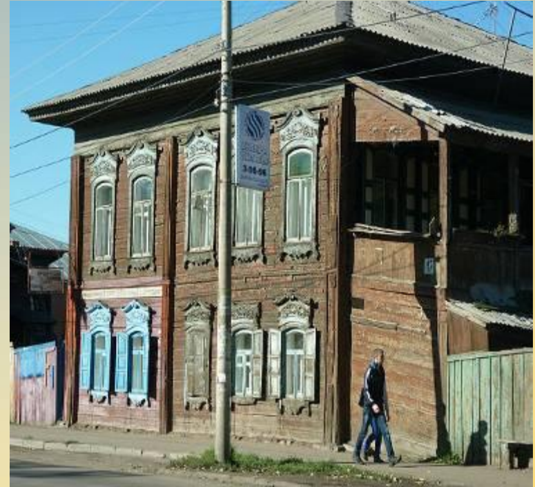
Административное здание почтовой службы 1870 год