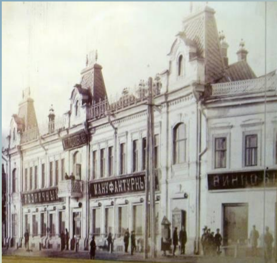
Проспект Гоголевский 1898 год