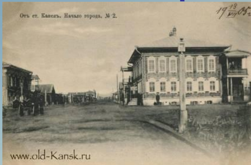
Начало г. Канска (рядом с городским рынком) 1800 год