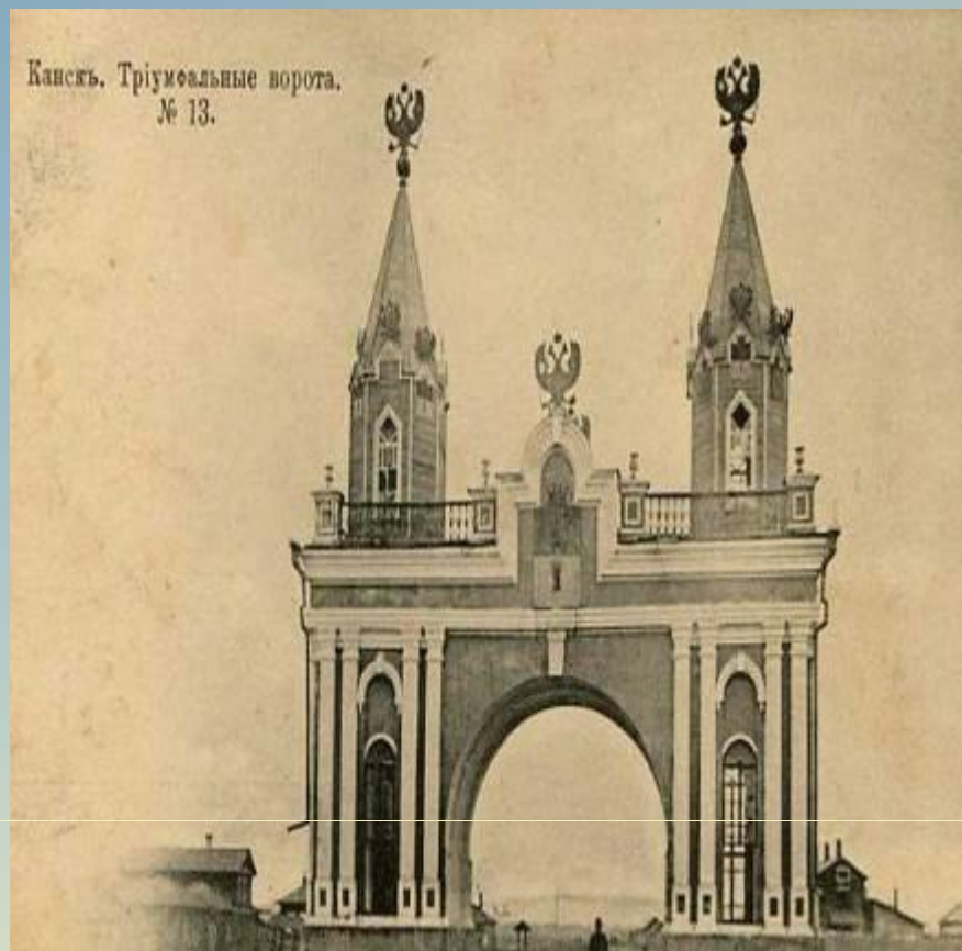
Триумфальные ворота 1891 год