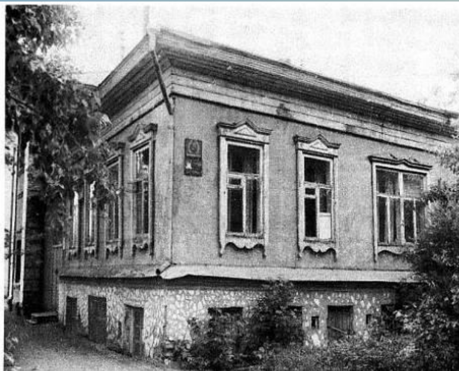
Бывший дом купца Коновалова, где открылся в 1900 году первый в городе кинематограф