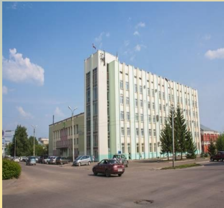
Мэрия города Канска