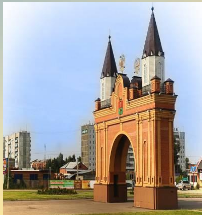
Триумфальная арка 2006 год