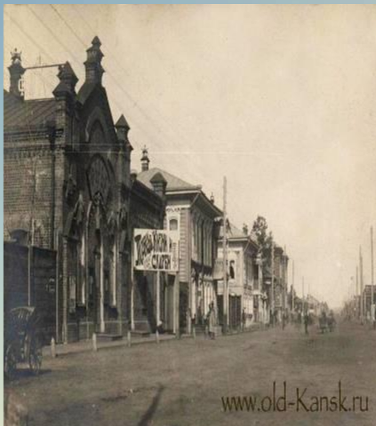
Кинотеатр «Фурор» 1911 год