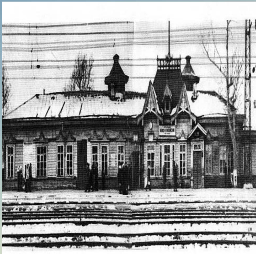
Здание вокзала, построенное в 1897 году