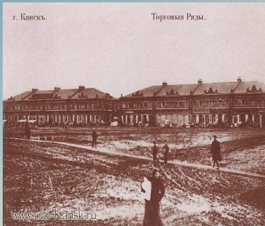
Торговые ряды 1907 год