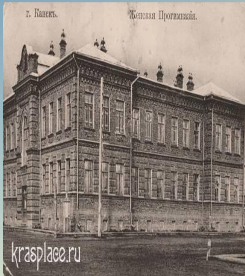
Женская прогимназия 1904 год