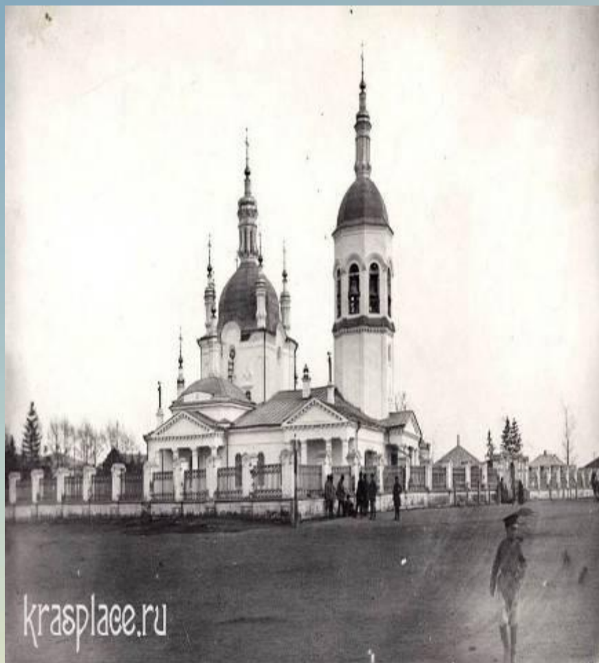
Построен в 1804 году Фотография 1914 года после реконструкции храма в 1912 году