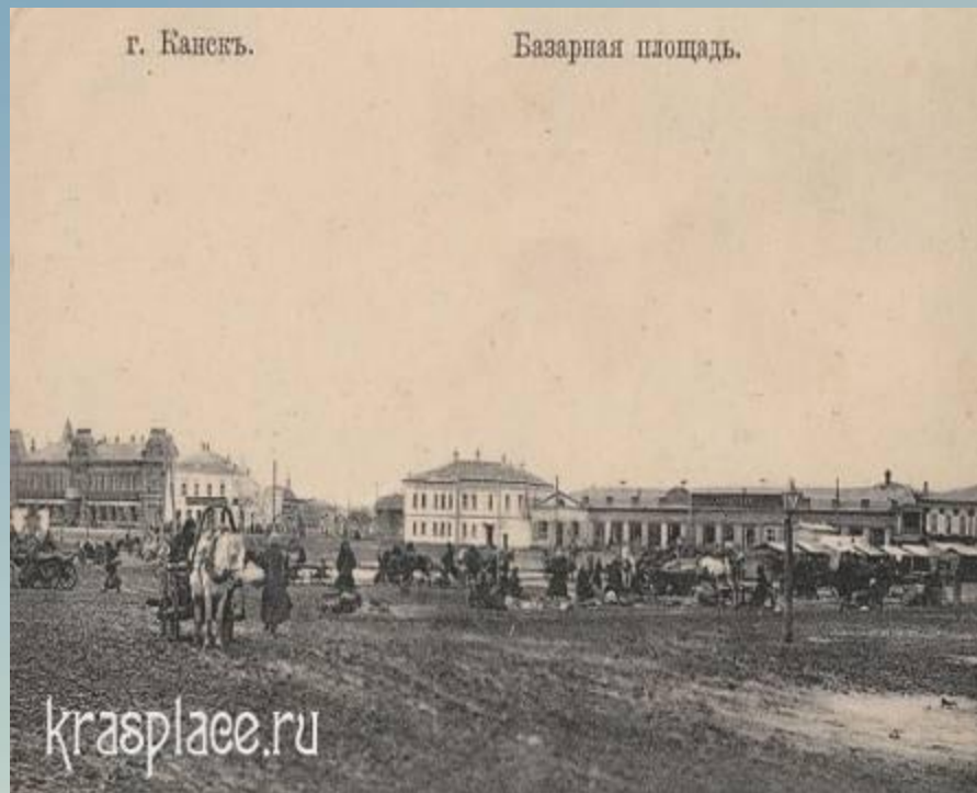
Базарная площадь 1900 – 1905 годы