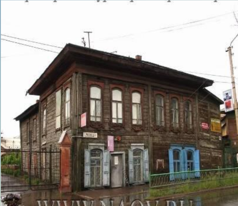
Почта и телеграфная станция, расположенная по улице Московской 19 век