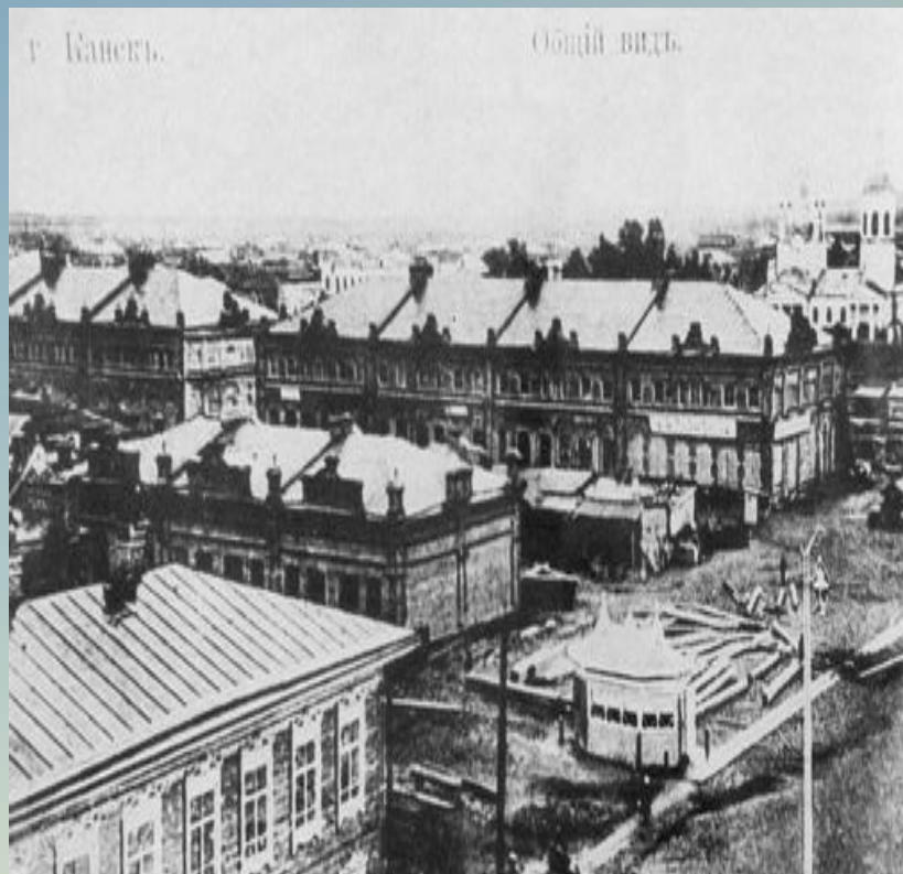
Вид на улицу Гостинодворскую, сейчас улица Краснопартизанская