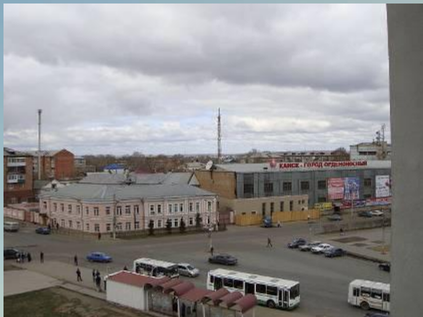
Здание городского казначейства