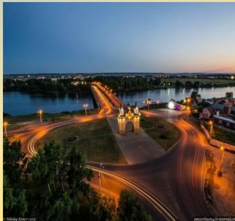
Правобережный район Предмостная площадь