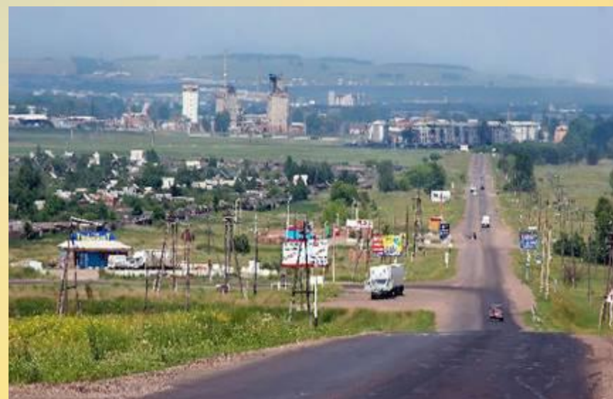
Въезд в Канск с Московской горы