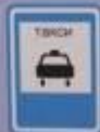
Место стоянки легковых такси