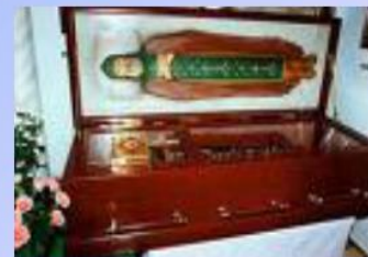
Мощи святых Петра и Февронии