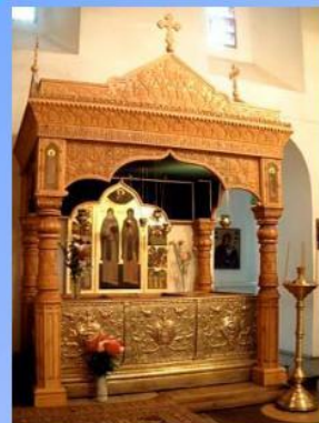
Рака с мощами святых Петра и Февронии в Муромском Свято-Троицком монастыре