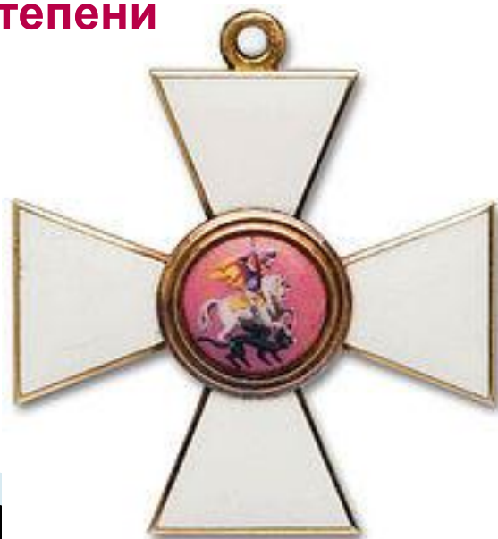
Орден Св. Георгия 4-й степени