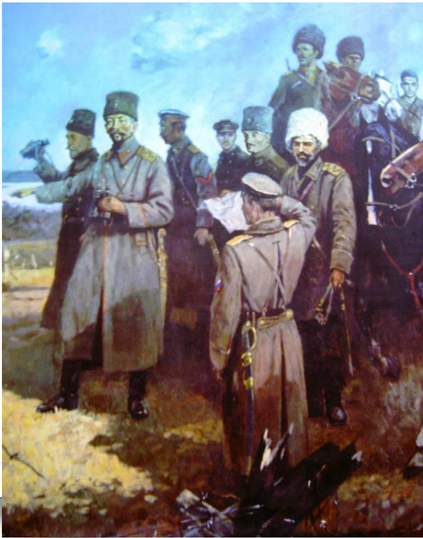
Командир 1-й пехотной бригады Добровольческой армии.