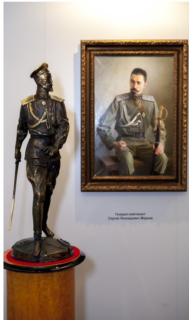
Генерал-лейтенант Сергей Леонидович Марков

"Верьте, что Родина вновь будет сильной Великой, Единой и Могучей..."