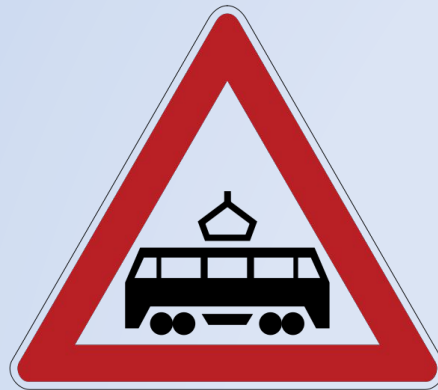
Пересечение трамвайных путей