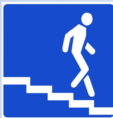
подземный пешеходный переход