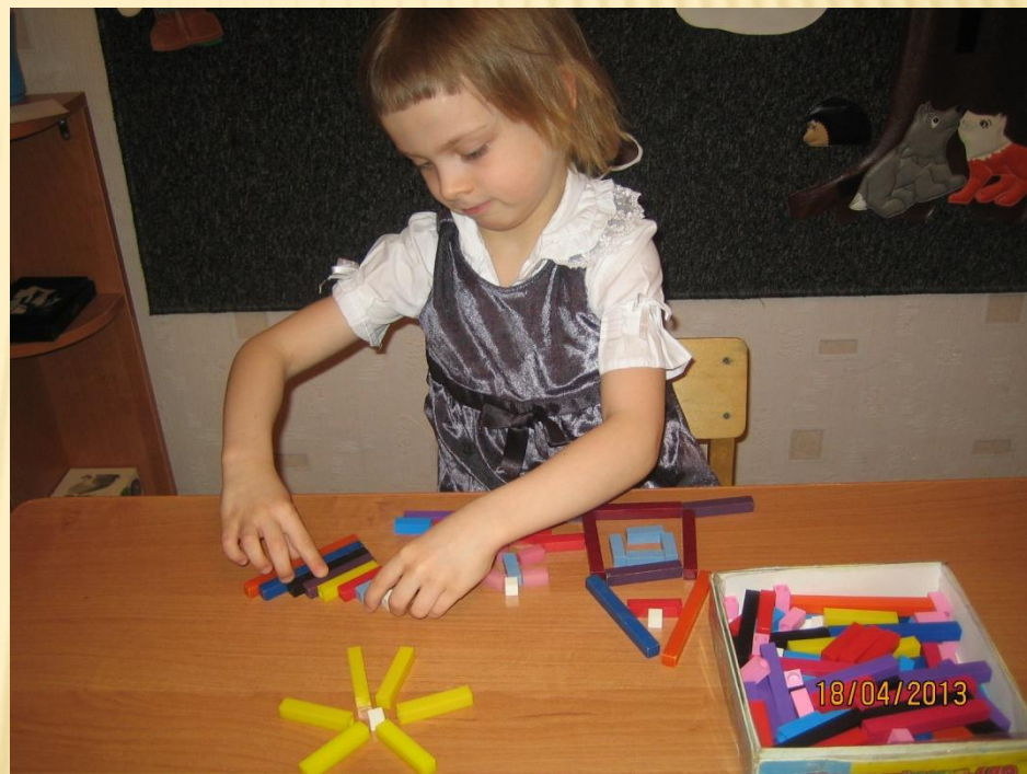
Палочки Кюизенера «Лесенка»