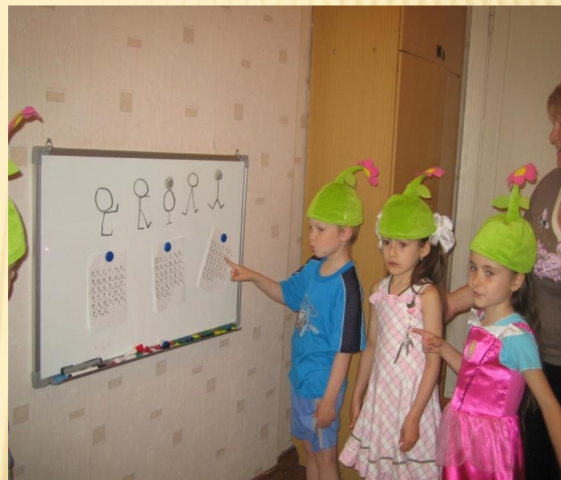
Кроссворды и ребусы