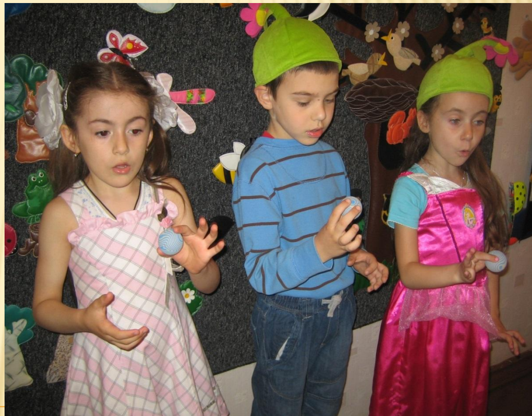
Игры с мячом