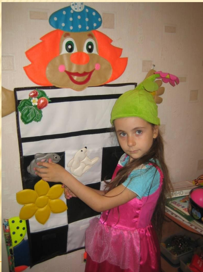
Игры на ассоциации, таблицы по мнемотехнике