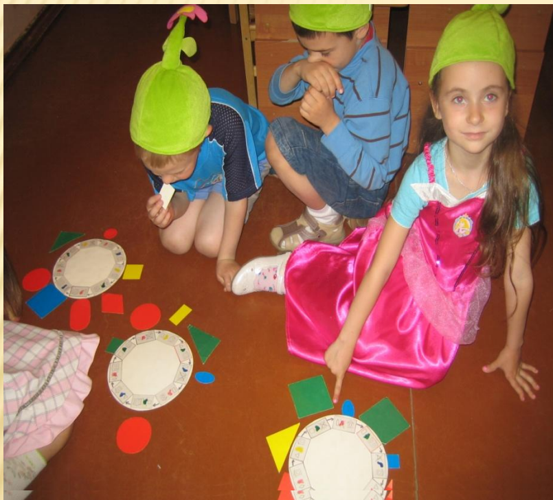
Блоки Дьенеша «Волшебные клубочки»