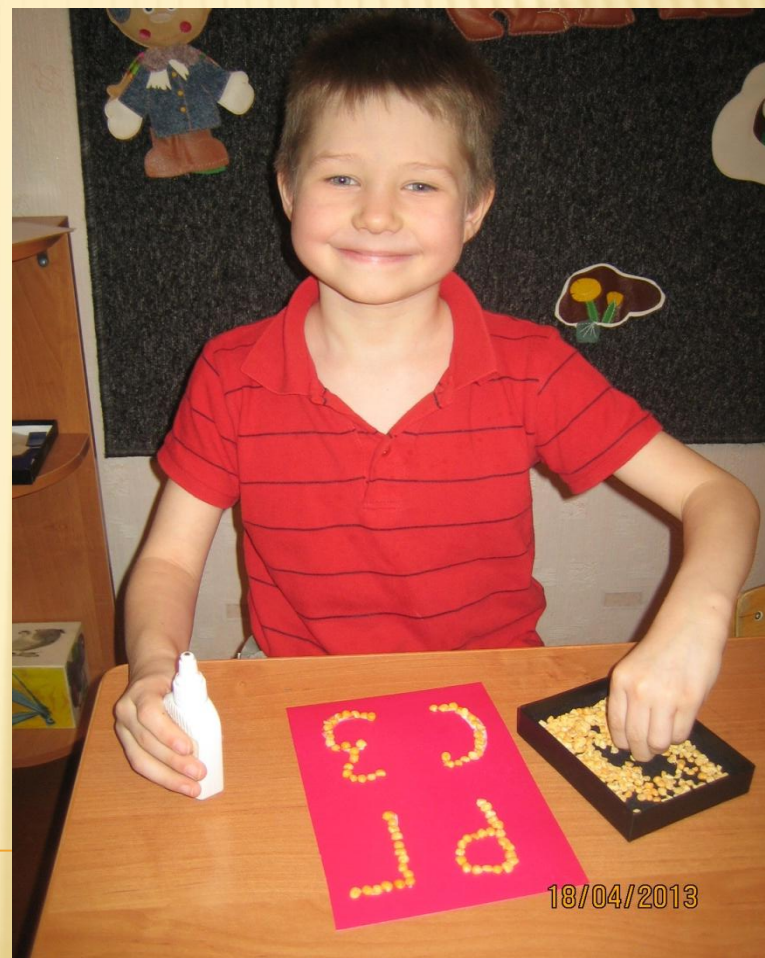
Выкладываем буквы из гороха