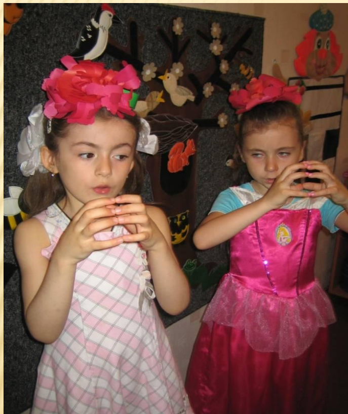
Пальчиковая гимнастика «Пион»