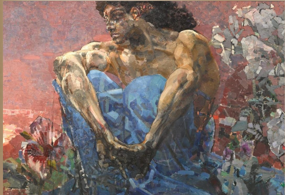
Михаил Врубель. «Демон сидящий»

Он дух изгнанья или страсти?! Опустошенья иль мечты? Сомненья дух или всевластья? Быть может, гений красоты?! Какая мощь! Какая сила В изломе гордого плеча! Легко Тамару покорил он, Сгорая страстью по ночам. Глаза! От них не оторваться: Они следят, они боятся, Что кто-нибудь, когда-нибудь Их тайны приоткроет суть. Что в них? Надменность иль страданье, Задумчивость иль пустота? Крушенье всех живых желаний Иль неземная высота?! <...>