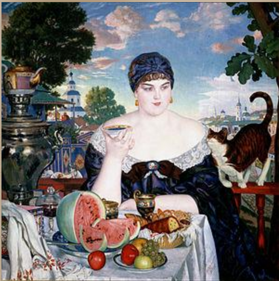
Борис Кустодиев. «Купчиха за чаем»