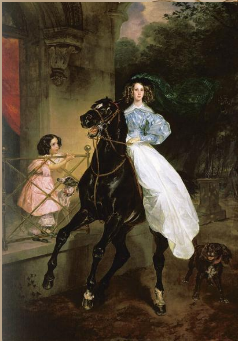
Карл Брюллов. «Всадница»