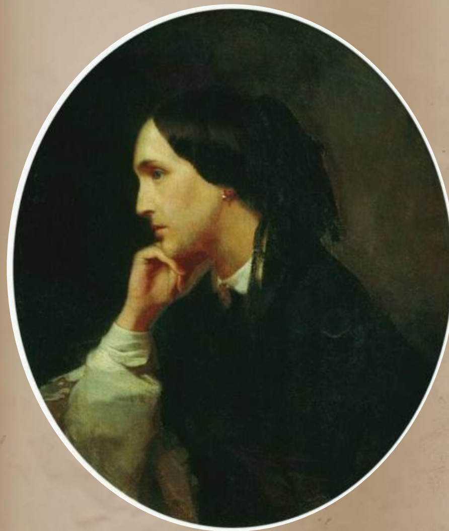
И. К. Макаров. «Портрет Н. Н. Пушкиной-Ланской»

*) Наталья Николаевна писала о нем: «Это один из лучших моих портретов...»