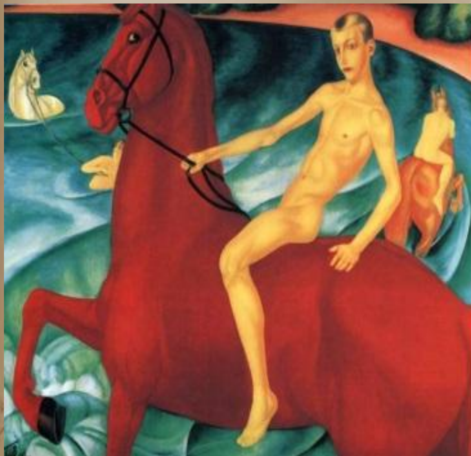
К. Петров-Водкин. «Купание красного коня»