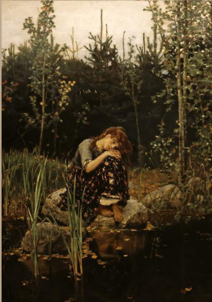
Виктор Васнецов. «Алёнушка»

Но кукушка на сосне кукует, И тропинка к берегу ведет, Солнце щедро на воду такую Золотые обручи кладет.