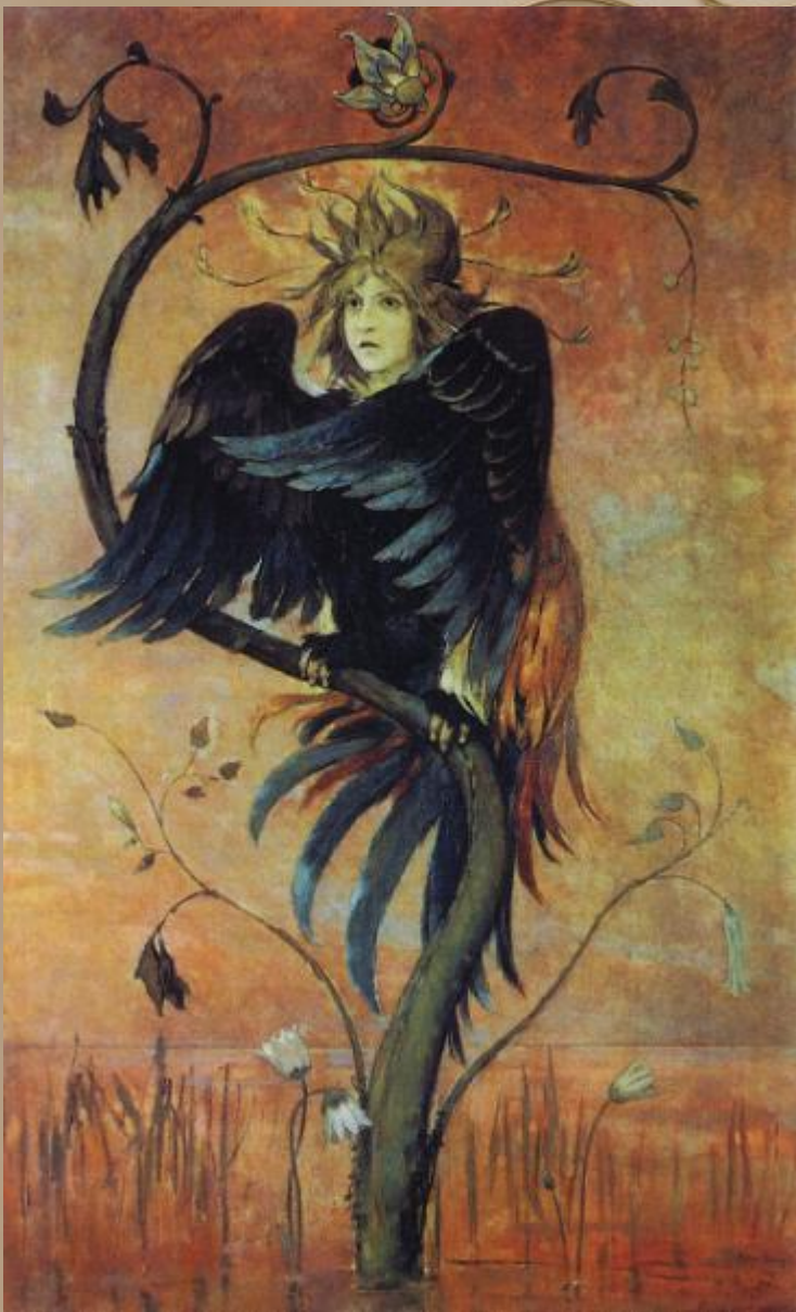
Виктор Васнецов. «Гамаюн».