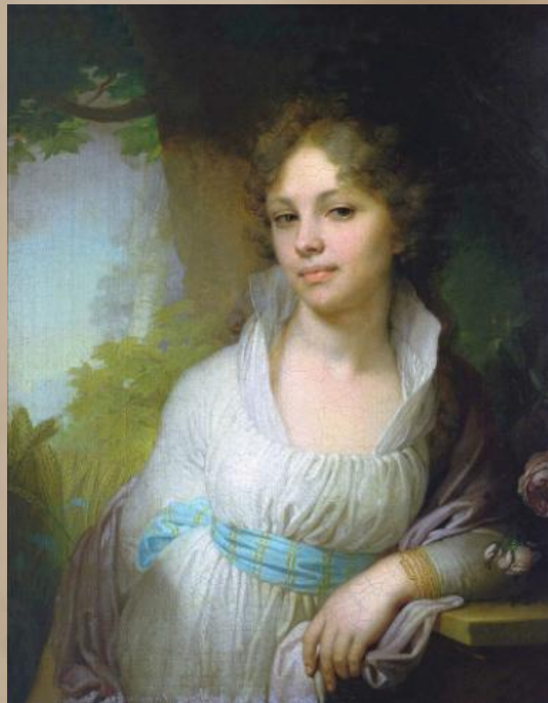
В. Боровиковский. «Портрет М.И.Лопухиной»

Она давно прошла, и нет уже тех глаз И той улыбки нет, что молча выражали Страданье — тень любви, и мысли — тень печали, Но красоту её Боровиковский спас. Так часть души её от нас не улетела, И будет этот взгляд и эта прелесть тела К ней равнодушное потомство привлекать, Уча его любить, страдать, прощать, молчать.