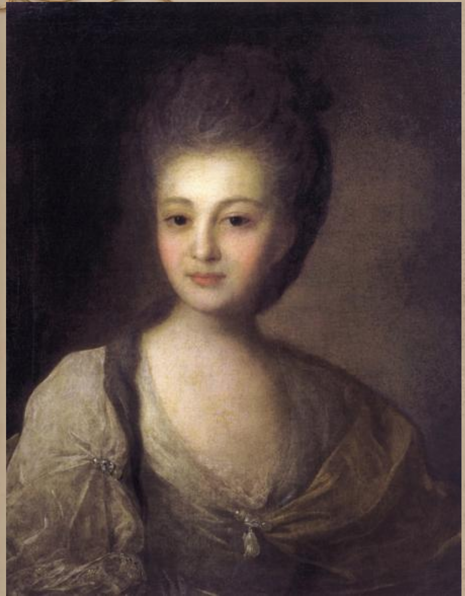
Фёдор Рокотов. «Портрет А. П. Струйской»

Когда потемки наступают И приближается гроза, Со дна души моей мерцают Ее прекрасные глаза.