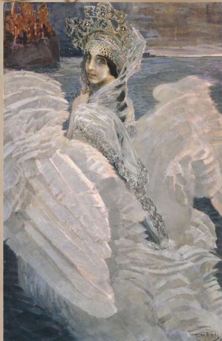
Михаил Врубель. «Царевна-Лебедь»