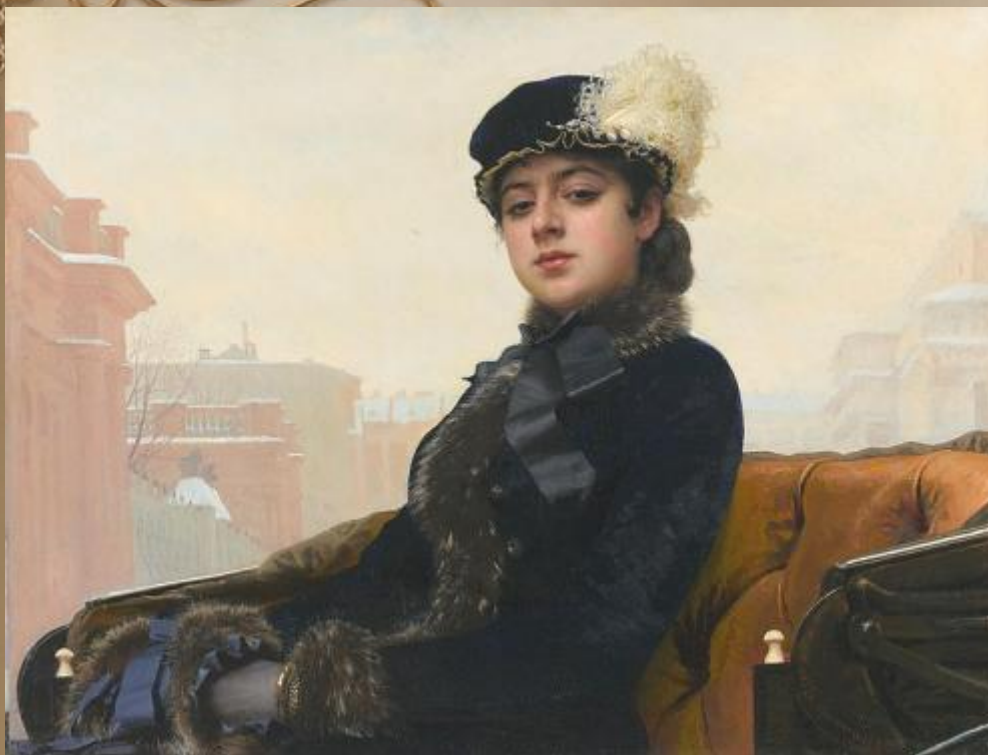
Иван Крамской . «Неизвестная»

Кто ты? Силой какой поднебесной Окрылён чуть надменный твой взгляд? И о чём, Чёрный Ангел прелестный, Уголки твоих глаз говорят?