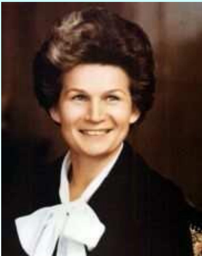
Терешкова Валентина Владимирова Первая женщина КОСМОНАВТ.