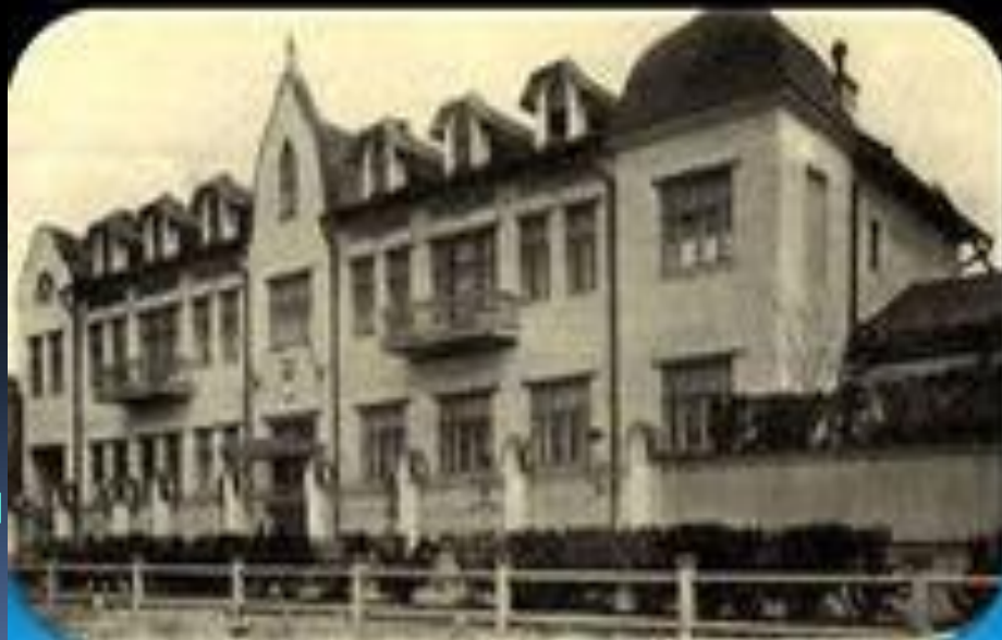
Здание Саратовского аэроклуба