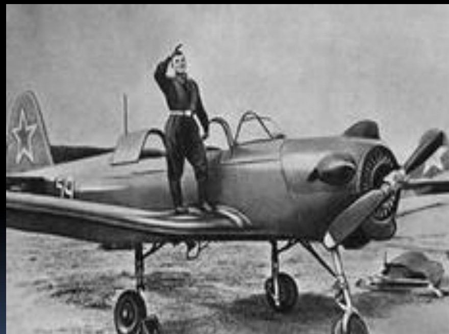
1 – е военно-авиационное училище лётчиков имени К.Е.Ворошилова