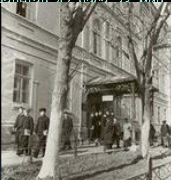
Саратовский индустриальный техникум.

В августе 1951 года Гагарин поступил в Саратовский индустриальный техникум, и 25 октября 1954 года впервые пришёл в Саратовский аэроклуб. В 1955 году Юрий Гагарин добился значительных успехов, закончил с отличием учёбу и совершил первый самостоятельный полёт на самолёте Як - 18. Всего в аэроклубе Юрий Гагарин выполнил 196 полётов и налетал 42 часа 23 мин.