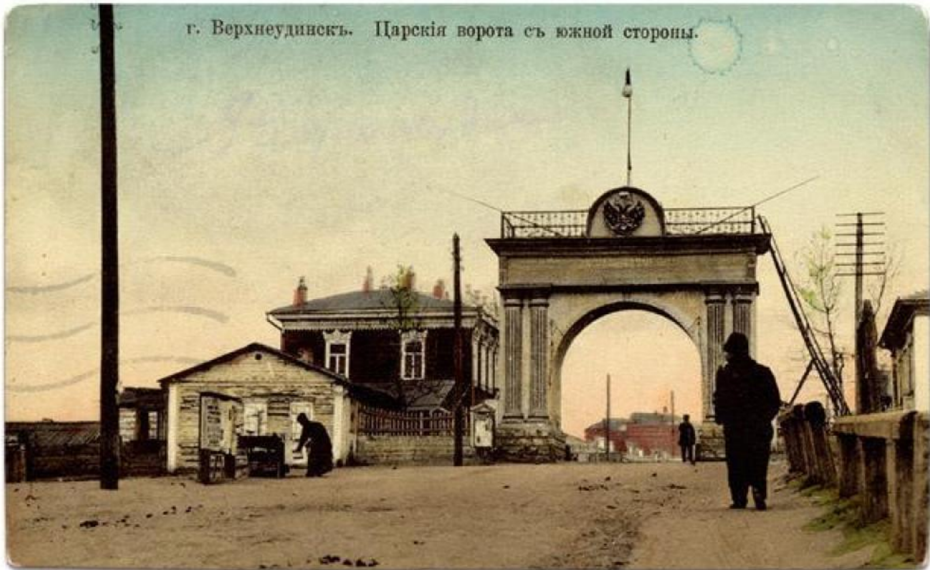
г. Верхнеудинскъ. Царскія ворота съ южной стороны.