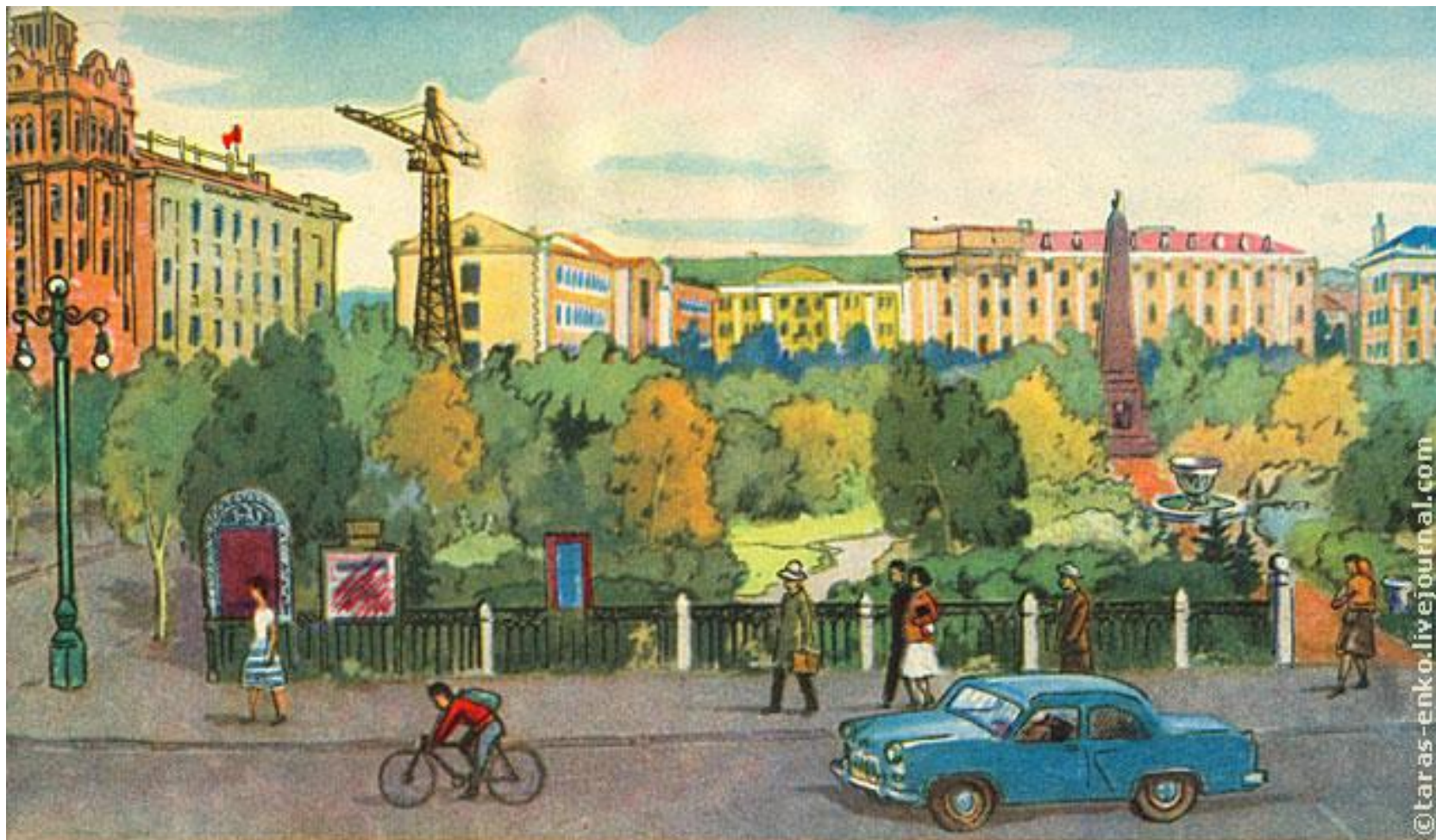
Сквер на площади Советов.