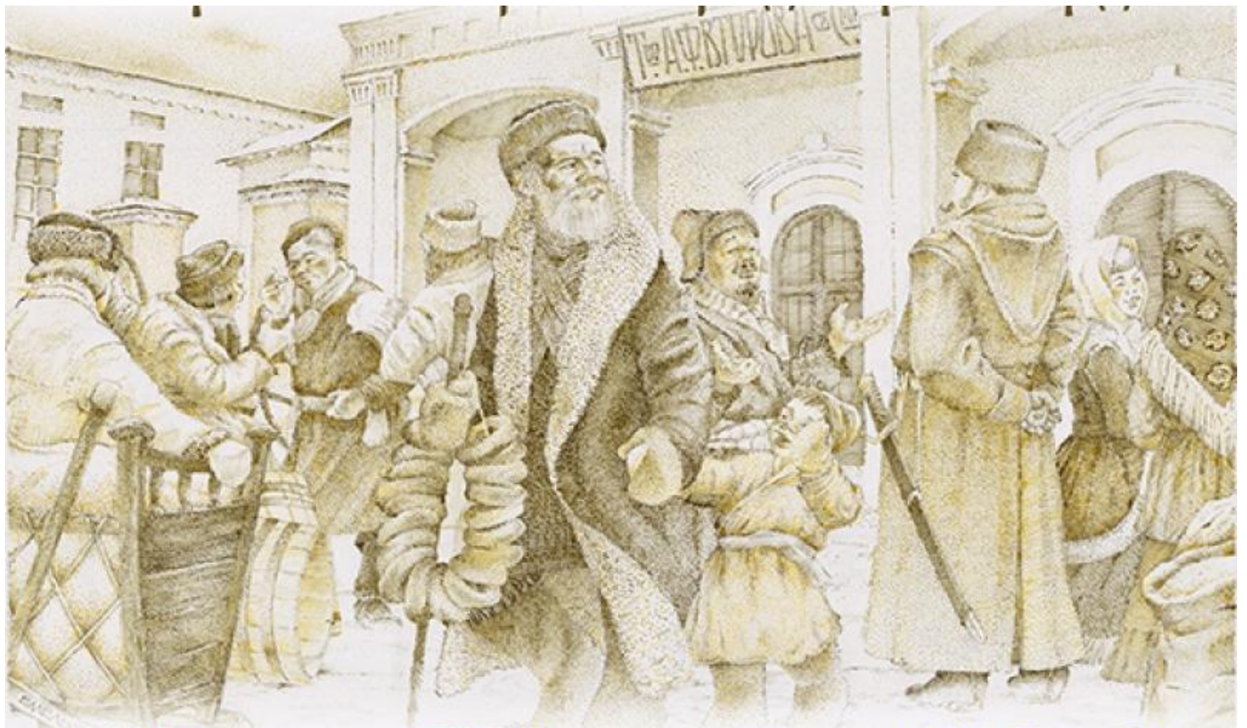
1666 Удинск - 1735 Верхнеудинск - 1934 Улан-Удэ