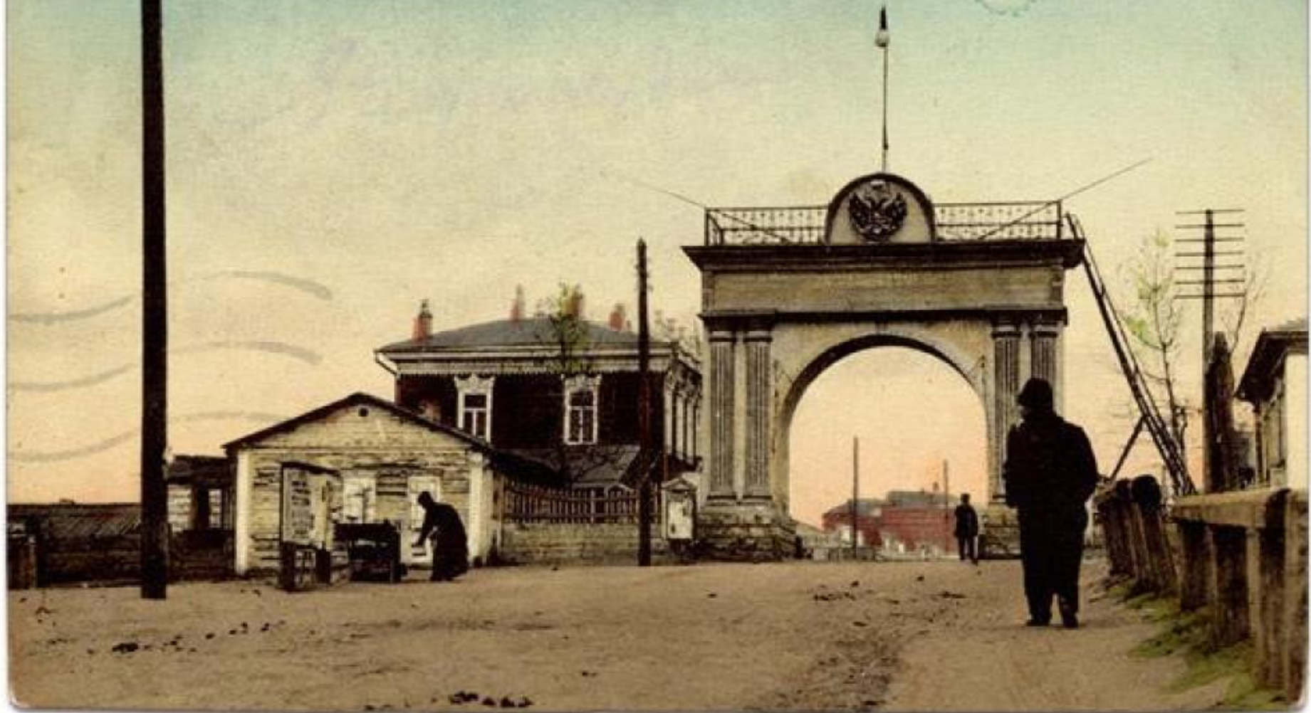
г. Верхнеудинскъ. Царскія ворота съ южной стороны.