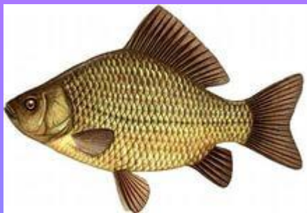
Карась - караси