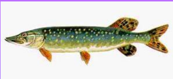
Щука - щуки